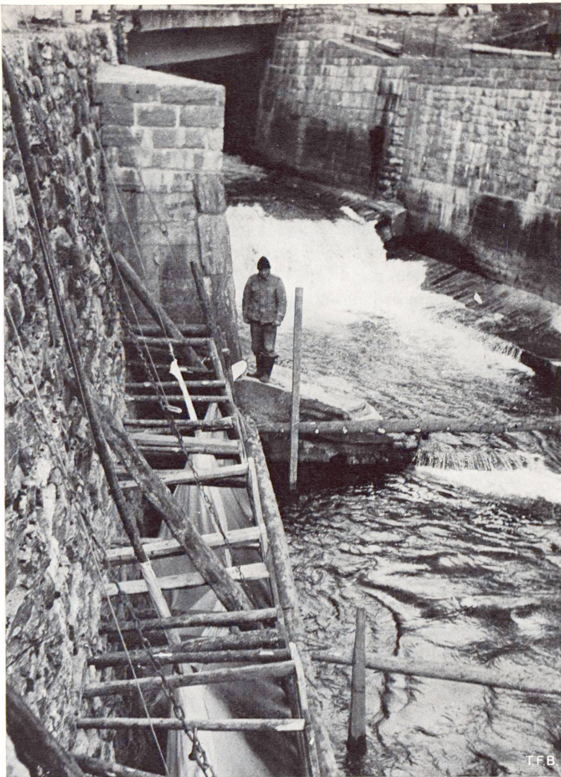
Fig. 4 Vue du container Colcrete protégé par un coffrage auxiliaire. On remarque au premier plan le tube pour le remplissage de l'enveloppe au moyen de mortier Colcrete.