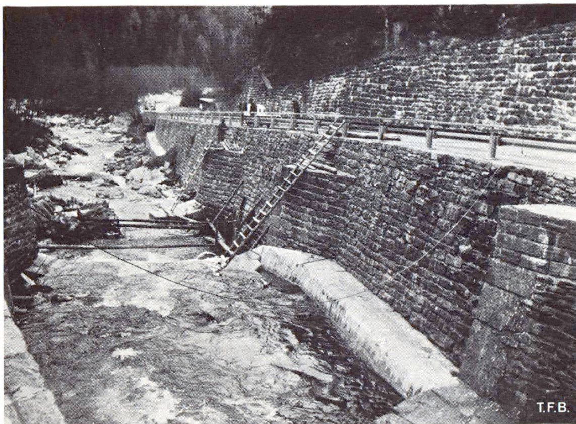
Fig. 5 Container Colcrete après remplissage au pied du mur de soutènement et après enlèvement du coffrage auxiliaire.