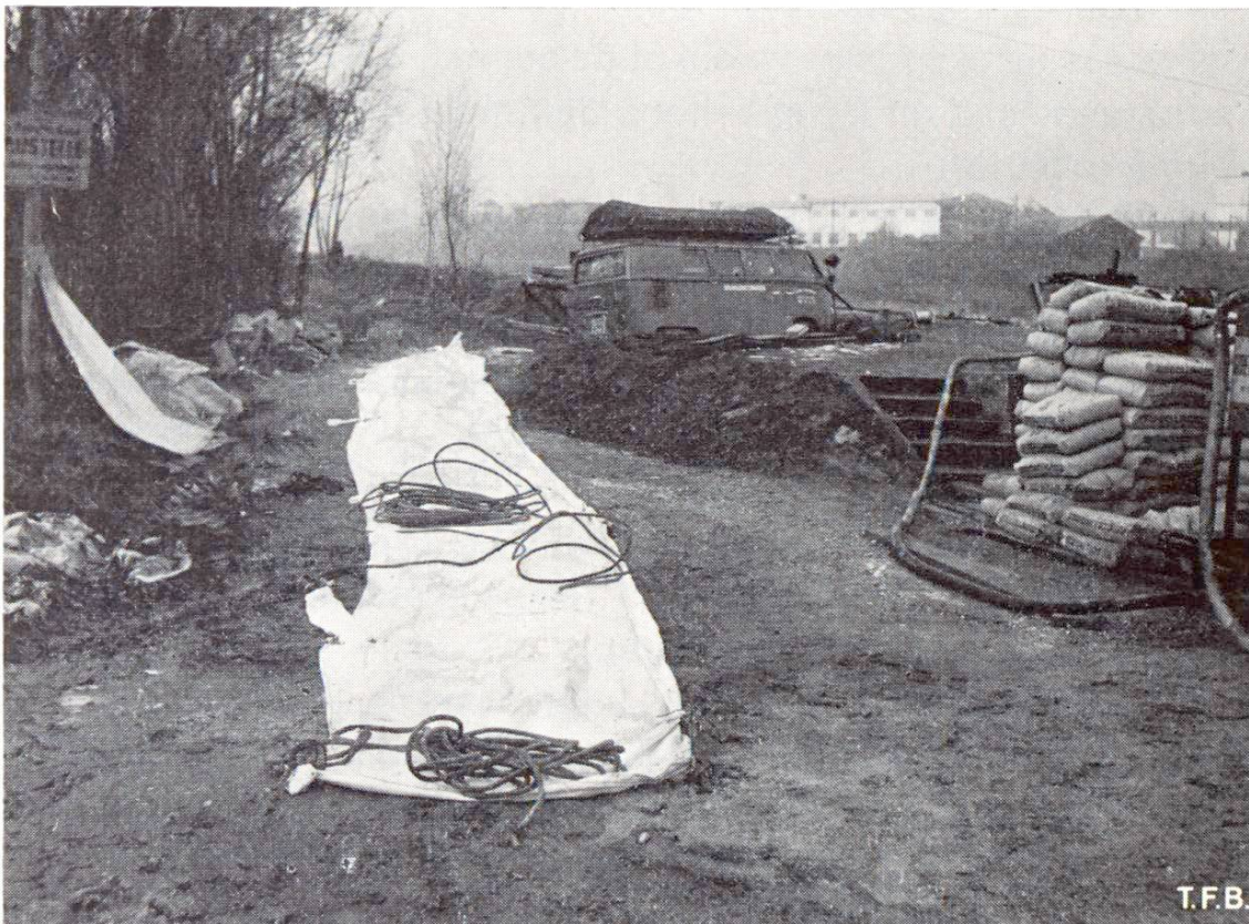
Fig. 1 Container Colcrete avant la pose. Enveloppe en tissu de 1,50 m de large et 20 m de long.

Ces enveloppes sont livrables en différentes largeurs entre 1.00 m et 2.00 m et en grandes longueurs à volonté. Leur contenance est de 10 à 20 m 3 et leurs poids de 20 à 40 t. Suivant les besoins, on utilise un ou plusieurs containers.