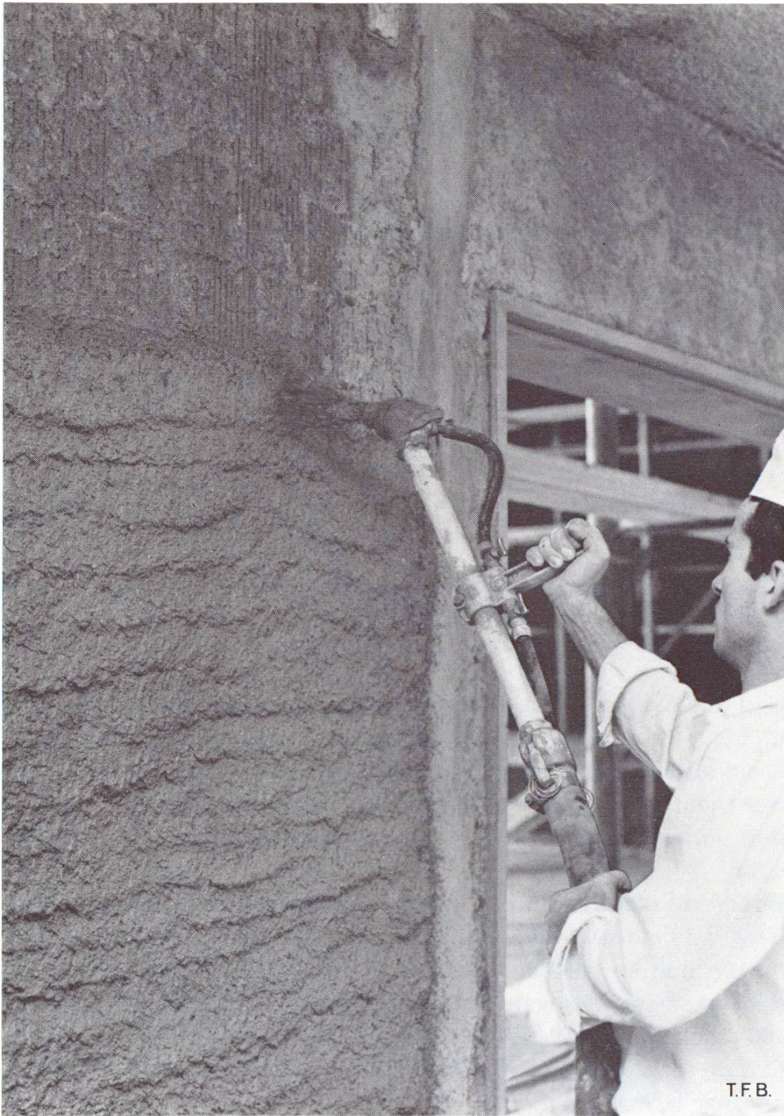
Fig. 1 L'outil de travail de l'application mécanique des enduits. On remarque le tuyau souple épais qui amène le mortier et le tuyau mince d'air comprimé. La tuyère permet d'accélérer le mortier par l'air comprimé et de l'appliquer avec force contre la paroi.