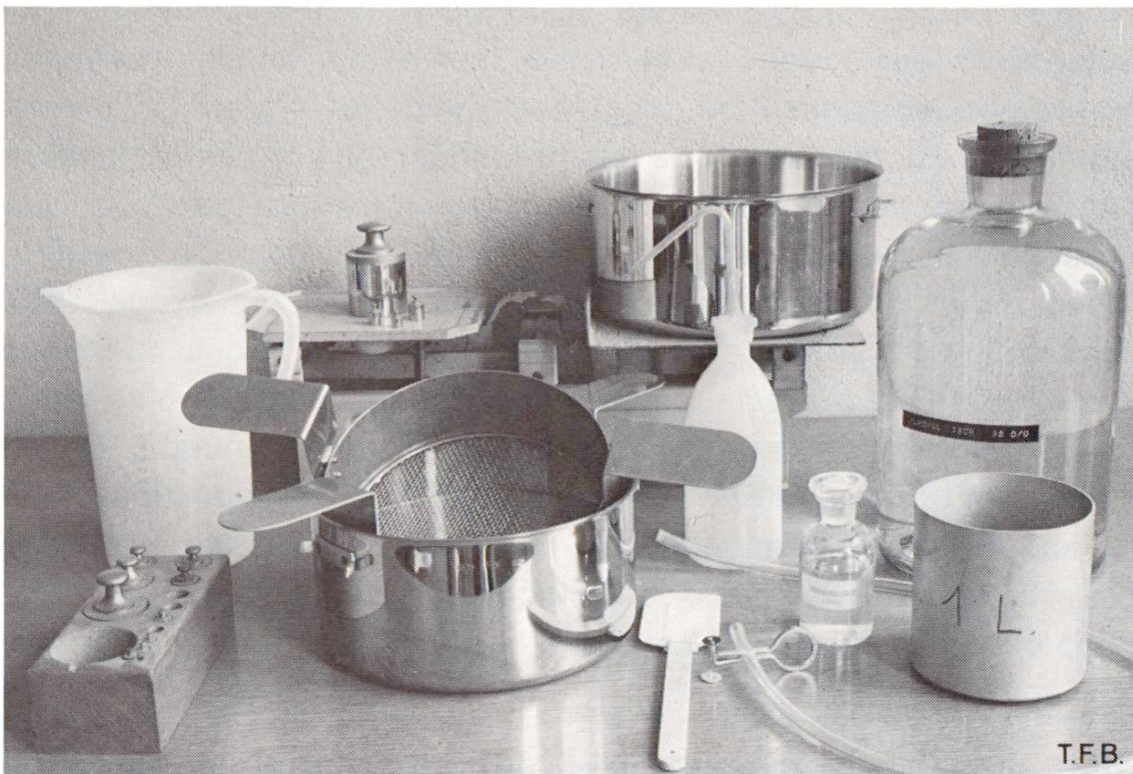
Fig. 1 Appareillage pour l'analyse du béton frais par la méthode « Canard » du LFEM se composant de: Balance avec série de poids, 2 marmites en acier de 22 et 24 cm de diamètre, 2 tamis de mailles 0,16 et 2 mm et de 20 et 19,5 cm de diamètre, tous deux avec poignées. 1 récipient de 1 litre, alcool industriel (1 à 1,5 l par analyse) à 10%, solution aqueuse de sucre de raisin, récipient de mesure de 2 l en plastic, pissette avec alcool, tuyau en caoutchouc avec pince-tube, spatule.

Le béton à examiner est placé dans un récipient où, après serrage par vibration, il occupe un volume de 1 litre; il est ensuite pesé, puis délayé dans l'alcool et versé sur un double tamis aux mailles de 2 mm et 0,16 mm placé dans un récipient en acier inoxydable. On procède alors au tamisage à l'alcool. Pour que cette opération soit rapide et complète, on ajoute à l'alcool un dispersant, à défaut de quoi le ciment coagulerait et obstruerait les mailles du tamis fin et le tamisat floclé contiendrait encore une quantité appréciable d'alcool et d'eau dont la séparation exigerait encore beaucoup de temps. Des essais ont montré qu'une petite quantité de sucre dissoute dans l'alcool aqueux était le meilleur dispersant pour le ciment. C'est le sucre de raisin qui convient le mieux. Sans adjonction de sucre, le ciment se dépose sous forme de flocons, occupe un volume près de trois fois plus grand et retient plus de trois fois plus d'alcool que s'il sédimente dans un alcool avec sucre (fig. 2). Dans un tel alcool, le ciment se dépose rapidement et forme un sédiment compact; l'alcool restant au-dessus peut être syphoné après 5 minutes déjà. Le peu d'alcool qui reste mêlé au sédiment peut être brûlé complètement en 10 minutes environ dans