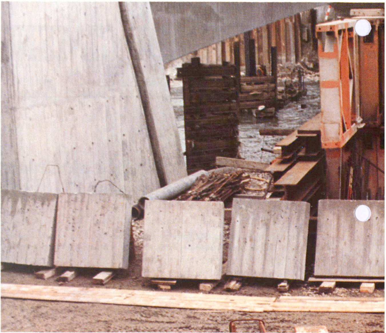
Fig. 1 Les 10 échantillons sur le chantier, à l'âge de 10 jours, 6 jours après le décoffrage. De gauche à droite: N os 5/3/10/6/8/9/1/7/4/2.

Les facteurs qui ont une influence sur la teinte grise du béton peuvent être énumérés de la façon suivante dans l'ordre décroissant de leur importance: