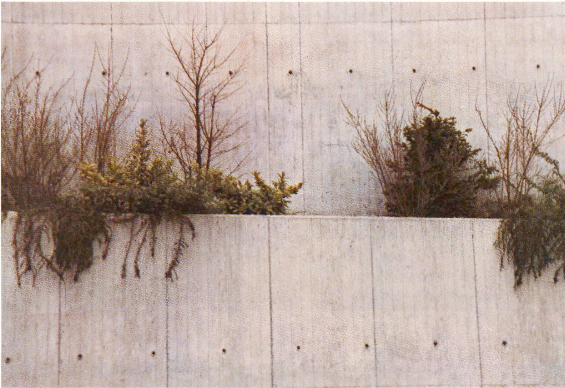
Fig. 5 Rampe de Vésenaz GE. Mur de soutènement en béton de ciment d'Eclépens. Au moyen d'un coffrage parfaitement étanche revêtu de plastique, on a obtenu un béton apparent très clair et régulier.