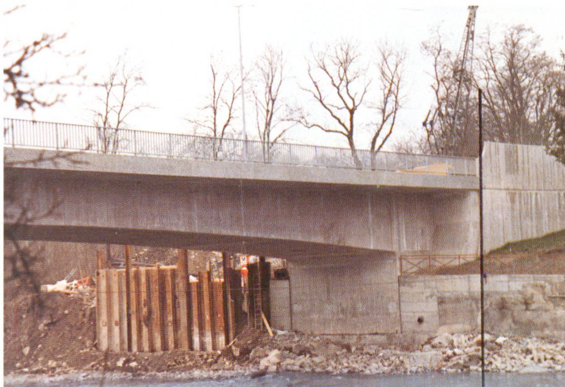
Fig. 4 Nouveau pont de Sierne I, Genève. Pour le pont proprement dit on a utilisé du ciment de Roche et pour la tête de pont, du ciment d'Eclépens (voir le trait de séparation tracé sur l'image). On ne constate aucune différence de teinte.

ment plus poreuse paraît plus claire et qu'elle est aussi plus sujette au dégagement de chaux claire.