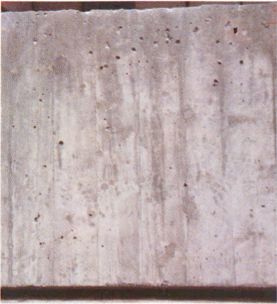
Fig. 3 Vue de près des échantillons 9/1/7/4/2 selon tableau 1.