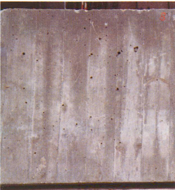
Fig. 2 Vue de près des échantillons 5/3/10/ 6/8 selon tableau 1.