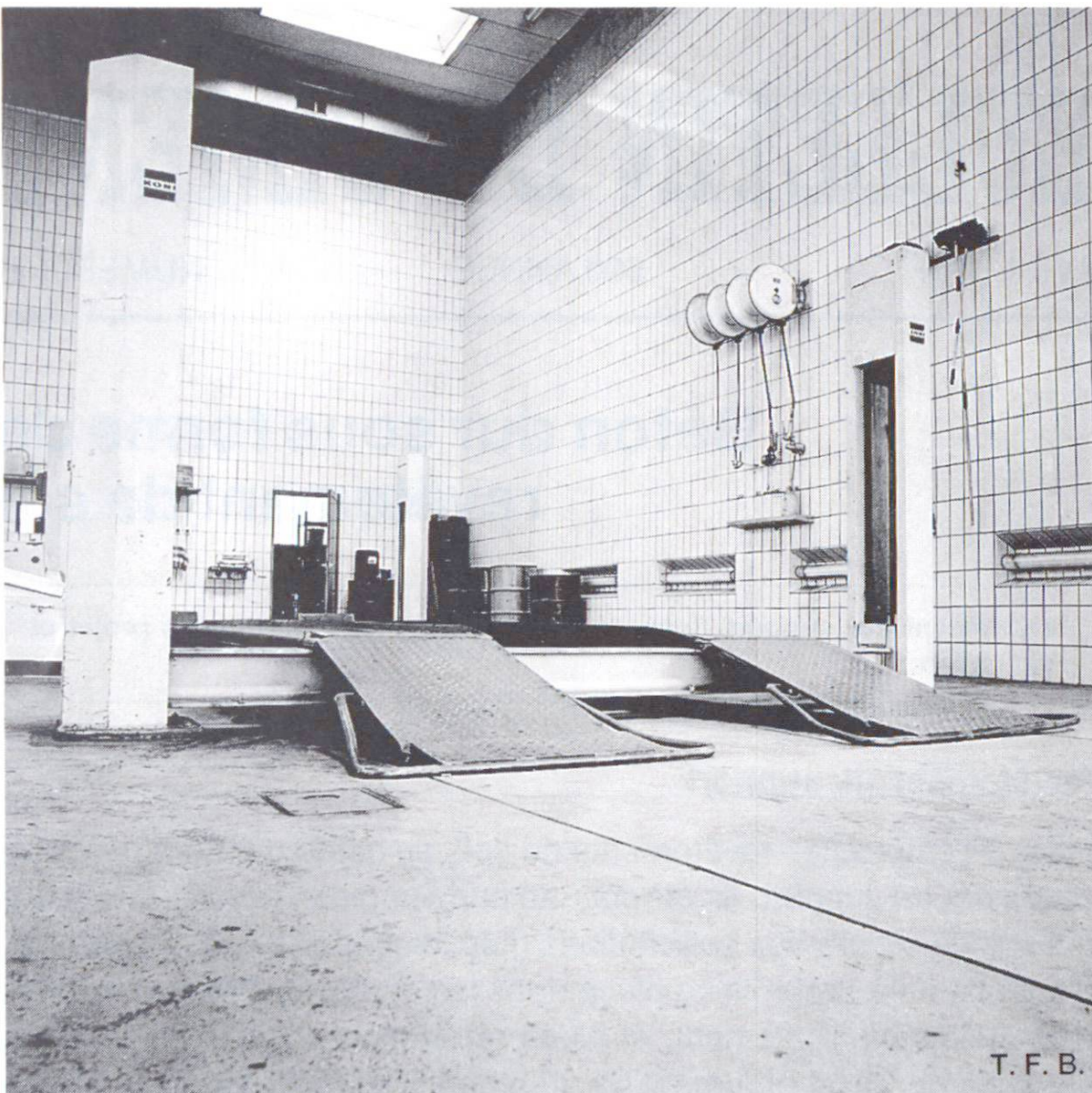
Fig. 1 Revêtement en béton dur achevé, pour un atelier déjà en service.

Comme pour tout revêtement de sol, l'étude du projet est du ressort de l'architecte. La structure du sol est simple, car, généralement, seules les sollicitations mécaniques importent. Si une isolation thermique et acoustique entre en considération, la solution des problèmes ainsi posés doit être étudiée spécialement, car le système béton dur/support ne témoigne pas d'une résistance particulière dans ce domaine. Mais en tant que revêtement à base de ciment, le béton dur est perméable à la vapeur et résiste à l'humidité. Il supporte de petites quantités d'huile, graisse ou solvant, mais pas les acides que peuvent contenir même des liquides anodins. Une sollicitation due au gel et au sel de dégel présenterait également des inconvénients et nécessiterait une formule onéreuse. C'est pourquoi il faut soigneusement définir l'utilisation prévue. Sur demande, le béton dur peut être teinté dans la masse. On ajoute alors des pigments colorants conformément aux règles de la technologie du béton.