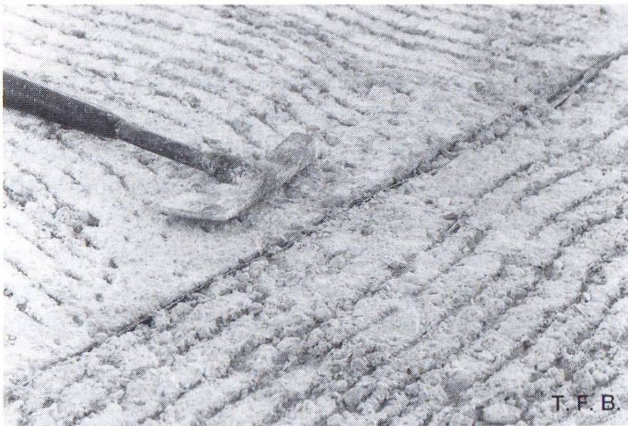
Fig. 8 Fond soigneusement préparé. Le joint de reprise est séparé au moyen de carton bitumé et peut être recouvert de béton dur. D'insignifiantes fissures capillaires peuvent à la rigueur apparaître.