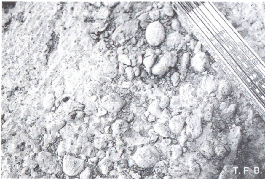
Fig. 4 Exemple d'un mauvais fond. Les parties se détachant doivent d'abord être éliminées.