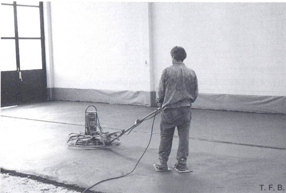
Fig. 3 Traitement de surface avec la machine à planer. Taloché fin avec le disque ou lissé avec les pales.