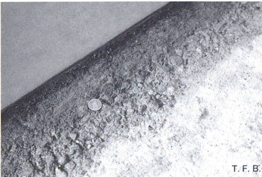
Fig. 9 Joint de reprise dans le béton dur. Il sera bétonné à fleur le jour suivant.

jours. Pendant ce temps – ainsi d'ailleurs qu'en cours d'exécution –, le revêtement est à protéger des courants d'air, de l'ensoleillement et des gouttes d'eau (fermer portes et fenêtres). Durant la période de chauffage, la température ambiante doit en outre se situer entre 5 et 15 °C. Les appareils de déshumidification ne peuvent être mis en service que 28 jours après l'achèvement des revêtements.