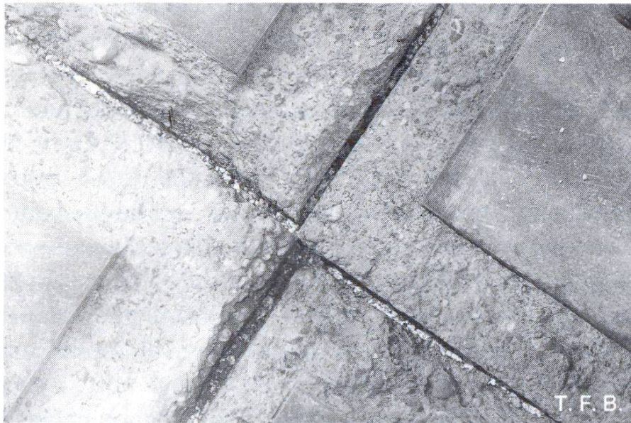
Fig. 7 Le doublage de joints souvent utilisé, composé de 10 mm et plus de produit mousse, est en l'occurrence inadéquat. De plus, les joints ne sont pas rectilignes. Dans la zone des arêtes, le béton dur a éclaté et il a fallu le remplacer. Conclusion: il faut exécuter soigneusement le coffrage latéral et utiliser des bandes couvre-joints de moins de 6 mm d'épaisseur.

Dans le revêtement en béton dur, les joints de reprise doivent également se trouver autant que possible dans des zones de faible passage, et être tirés au cordeau (fig. 9). On les exécute comme suit à la fin d'une étape journalière: on les trace au cordeau, on les découpe proprement et on les bétonne à fleur le jour suivant. On peut raccorder le béton dur aux murs et piliers montants qui sont assemblés au support.