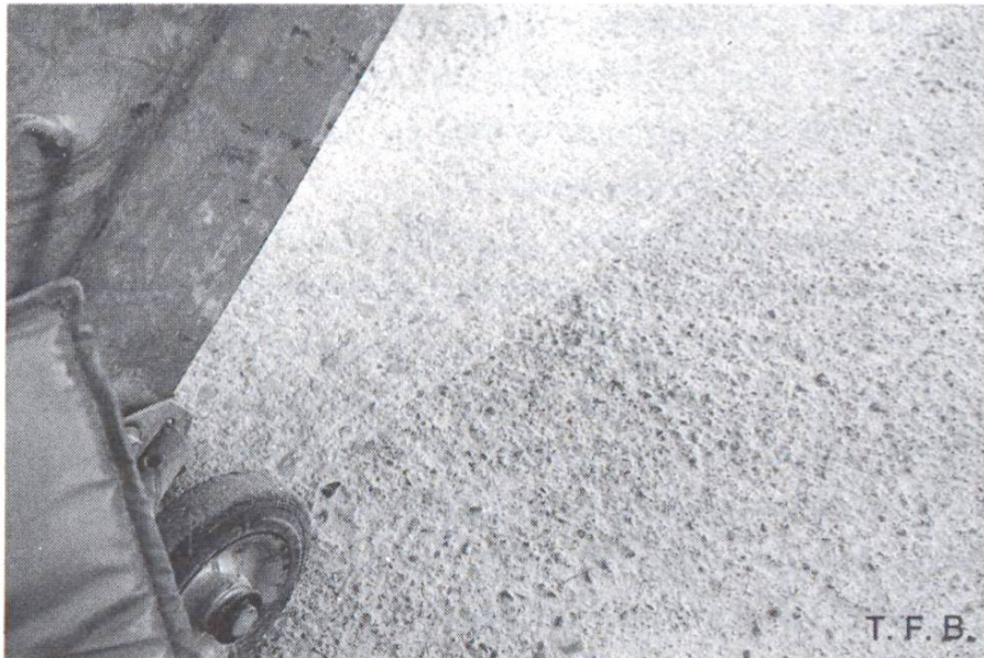
Fig. 5 Exemple d'un bon fond. Une opération de fraisage suffit.