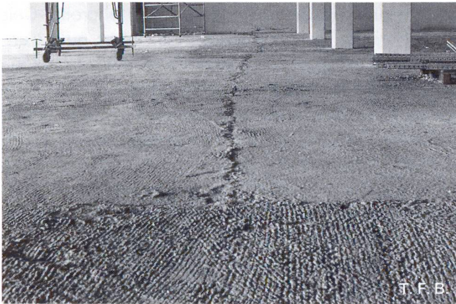
Fig. 6 Exemple d'un mauvais joint de reprise dans la dalle de fond flottante. Il est trop large, pas rectiligne, et a de mauvaises arêtes. Un béton dur ne pourra pas résister aux sollicitations prévues dans cette zone.