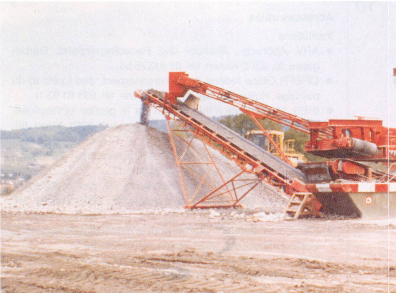
Installation de traitement de gravats en service.