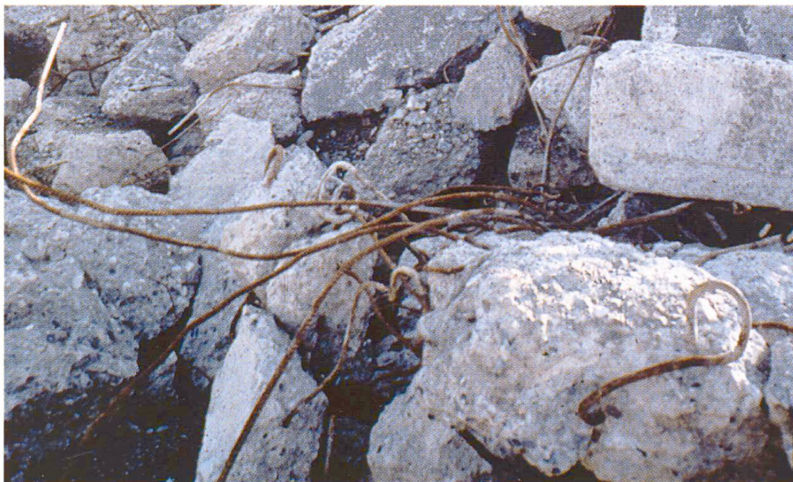
Béton de défonçage de route brut, avec treillis d'armature, qui, après un traitement approprié, s'est transformé en une précieuse matière première utilisée pour l'aménagement de la N 13 dans la partie saint-galloise de la vallée du Rhin.

tion réduit la capacité d'absorption d'eau du sol, augmente sa résistance au gel et accroît sa portance. La consolidation avec du ciment réduit énormément la possibilité d'élution de substances polluantes.