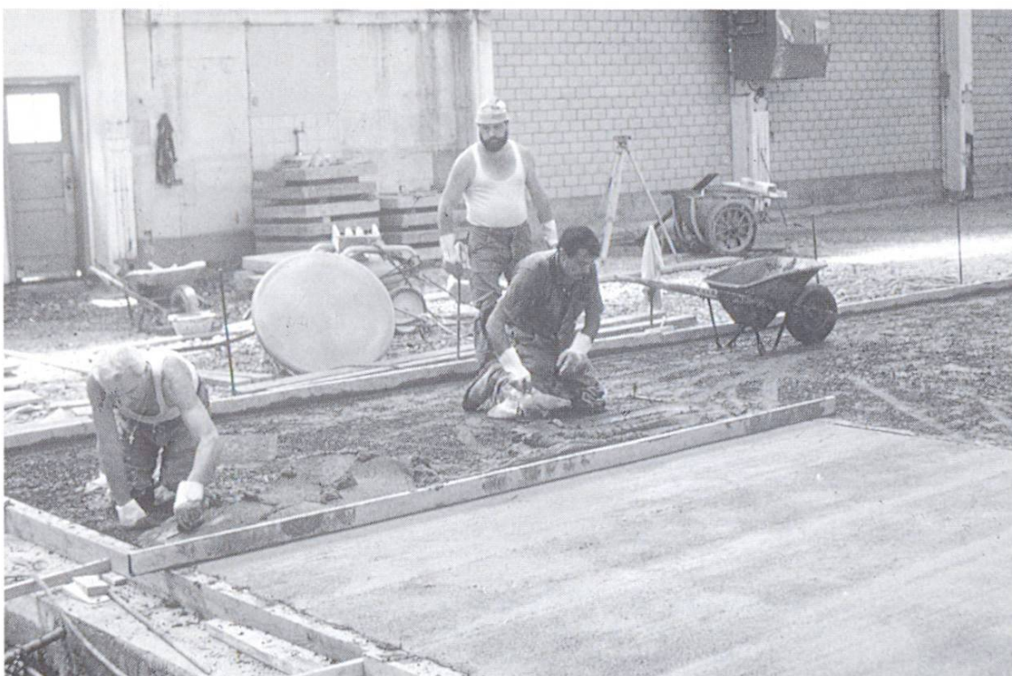
Les sols industriels faiblement sollicités sont un important domaine d'application du béton renforcé de fibres synthétiques.

Parce qu'elles sont noyées dans la matrice, les fibres qui ne se trouvent pas tout près de la surface sont bien protégées contre les