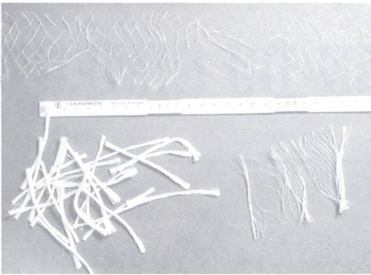
Fibres de polypropylène fibrillées telles qu'elles sont livrées (en bas à gauche), ainsi qu'à deux stades de la dispersion.

Les fibres de polyacrylonitrile , à section réniforme et surface finement structurée, ont été mises au point au début des années 80, initialement pour remplacer l'amiante dans le fibrociment. Un peu plus tard, on a produit de nouveaux types de ces fibres, avec des diamètres entre 13 et 104 \mu\text{m} (0,013 à 0,104 mm) et des longueurs entre 20 et 60 mm. Pour l'armature des bétons et mortiers, ce sont les fibres de diamètre à partir de 50 \mu\text{m} et longueur de 6 à 24 mm qui semblent avoir donné les meilleurs résultats. Leur module d'élasticité de 16 à 19 \text{kN}/\text{mm}^2 représente environ la moitié de celui des mortiers et bétons, alors que leur allongement à la rupture (10 %) est beaucoup plus grand que celui des fibres d'acier (3–4 %) [3, 5].