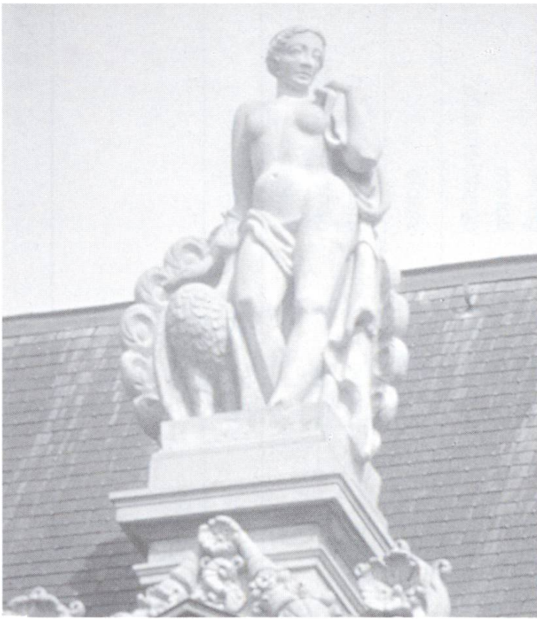
Sculpture en grès artificiel au Schauspielhaus de Zurich (béton fin renforcé de fibres synthétiques).