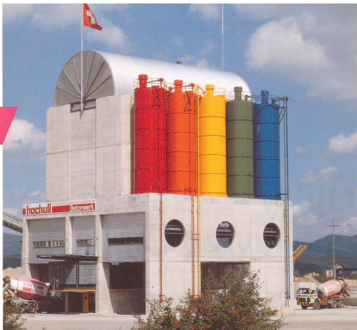
Centrale de béton prêt à l'emploi moderne.