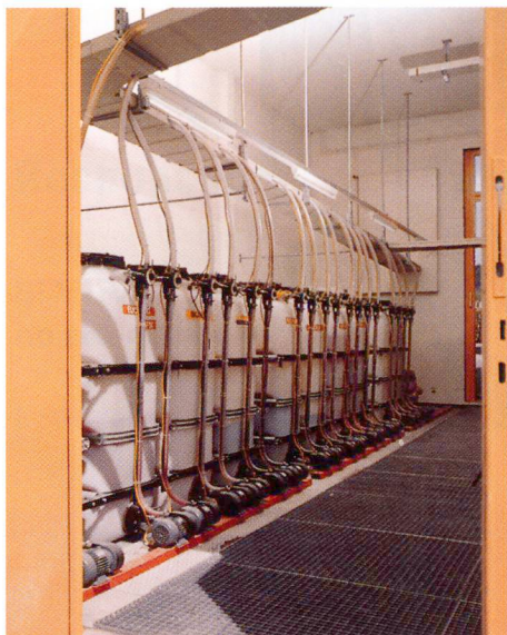
Entrepôt des adjuvants.