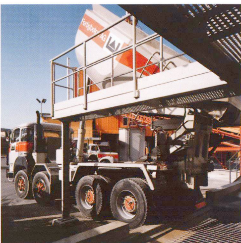
Nettoyage du tombereau.

De même les centrales de BPE sont en mesure de livrer en été un béton adapté aux conditions climatiques particulières.