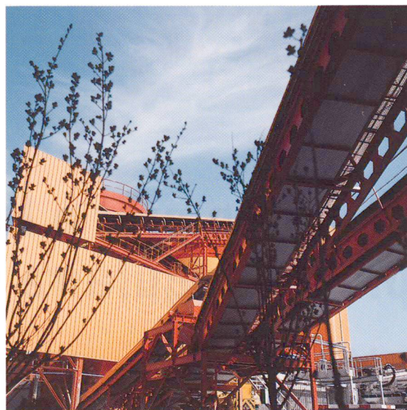
Amenée des granulats.