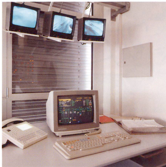
Commande de la production par PC.