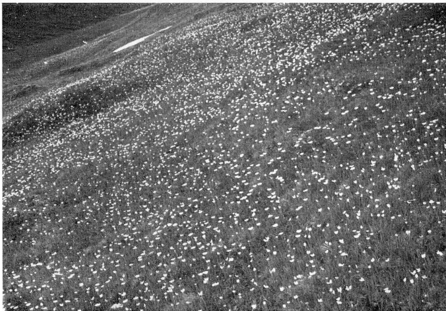
Abb. 4. Berghang unterhalb Chanrion, hinterstes Val de Bagnes, ca. 2400 m, im Frühlingsaspekt: Massenvegetation von Ranunculus pyrenaicus im Weiderasen. – Phot. P. Güntert, 21.VII.1955.