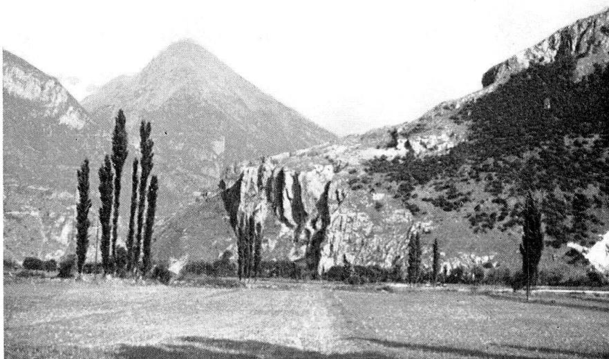
Abb. 2. Felsenecke der Follatères. Blick talabwärts. Am Fusse der Felsen die Rhone. Im Hintergrunde die Pyramide der Dent de Salantin (2485 m). Am Berghang Felsensteppe, durchsetzt von Gebüsch und Niederwald ( Corylus , Quercus pubescens u. a.). – Phot. P. Güntert, 17.VII.1955.