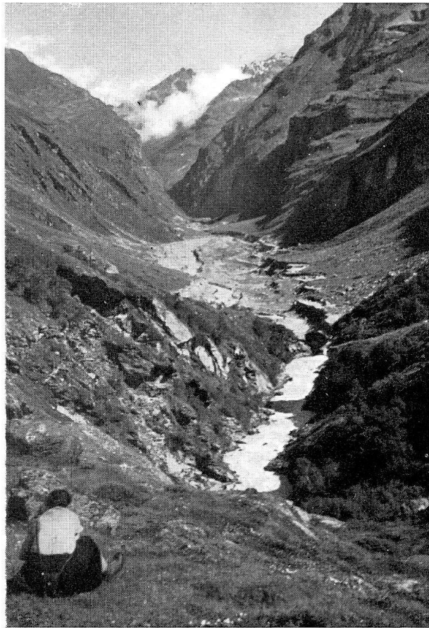
Abb. 3. Im hintern Val de Bagnes, Blick talauswärts von Torrembé, ca. 1850 m, aus. In der Talenge im Hintergrund wird die Staumauer von Mauvoisin errichtet, die das ganze Tal bis in 1960 m Höhe in einen Stausee verwandelt. Im Talboden des Mittelgrundes grosse Ausbeutung von Kies und Sand für die Erstellung der Staumauer. Talhänge völlig baumlos, obschon die tieferen Teile weit unter der Waldgrenze liegen. Dagegen Gebüsch von Grünerlen mit Hochstauden. – Phot. M. Schuppisser, 21.VII.1955.