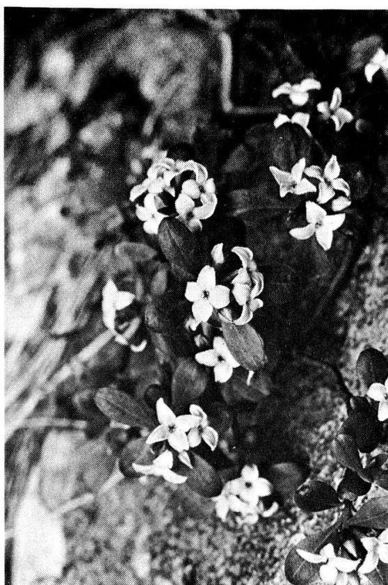
Abb. 1. D. Reichsteinii (1/6 x)