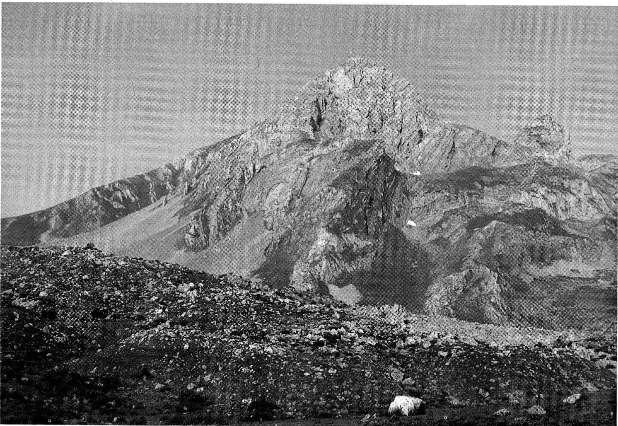
Fig. 2. Die Peña Ubiña (2417 m) im Kantabrischen Gebirge, Sicht auf die Ost-Flanke. Peña Ubiña (2417 m) in the Cantabric mountains, view of the eastern flank.

Die an drei Stellen unterschiedlicher Höhe und Exposition vorgenommenen pflanzensoziologischen Aufnahmen (Tab. 1) ergaben folgende Arten als häufigste R. seguieri -Begleiter (in mindestens 2 der 3 Flächen vorhanden): Arenaria grandiflora , Cerastium alpinum , Galium pinetorum , Helianthemum croceum , Helictotrichon sedenense , Pimpinella tragioides s.l. und Thymus praecox . Ebenfalls angetroffen wurden Arabis alpina , Euphorbia chamaebuxus und Iberis pruitii , 3 Arten, welche von RIVAS-MARTÍNEZ (1969) dem Linarion filicaulis , einem im Kantabrischen Gebirge endemischen Verband der Thlaspietalia rotundifolii , zugeordnet werden. Diese Verbands-Zugehörigkeit von R. seguieri im Kantabrischen Gebirge wird von RIVAS-MARTÍNEZ et al. (1971) bestätigt. Auch in den Alpen und im Jura kommt R. seguieri in verschiedenen Kalkschutt-Gesellschaften der Thlaspietalia rotundifolii vor (Zusammenstellung in HUBER 1988).