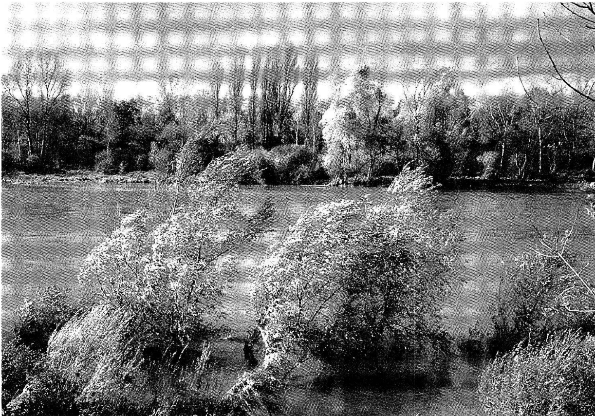
Abb. 2. Am Rande einer Weichholzaue bei Hochwasser. Im Falle der Kartierung für ein Landschaftsentwicklungskonzept bietet der Katalog der Landschaftselemente mehrere Möglichkeiten: Interessiert vor allem der aktuelle Zustand, wird die Vegetation Kartierungseinheiten stellen – im Beispiel etwa Silberweiden-Auwälder und Flussröhrichte. Wird ein besonderer Stellenwert der weiteren Entwicklung beigemessen, bietet sich eine morphologische Kartierung an mit der Haupteinheit «Tieflandsfluss» und speziell signierten Alluvionen (z.B. Kiesbänken). Oberrheingebiet, Photo: Thomas Coch.

Schliesslich gilt es auch, vorhandene Inventare von Natur- und Kulturobjekten sorgfältig zu aktualisieren und mittels Erfolgskontrollen die Auswirkungen der jeweiligen Schutzmassnahmen zu überprüfen (vgl. Abb. 3). Auch in diesem Aufgabenfeld bewährt sich die Einbindung der CD in gängige GIS-Programme. So kann beispielsweise der Zustand eines Schutzgebietes mit Hilfe historischer und aktueller Luftbilder einer