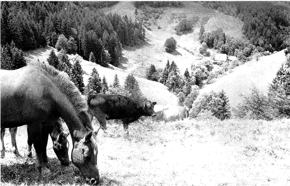
Abb. 3. Schutzgebiete, deren Schutzziele den Erhalt traditioneller Bewirtschaftungsformen voraussetzen, leiden oft unter der Nutzungsaufgabe. Mittels luftbildgestützten Zeitreihenanalysen auf gemeinsamer kartographischer Basis lassen sich Ausmass und Steuergrößen einer solchen Entwicklung analysieren. Die Landschafts-CD stellt hierzu mit luftbildtauglichen Kartierungsschlüsseln und einer GIS-Anbindung die nötigen Werkzeuge zur Verfügung. Napfgebiet, Photo: Thomas Coch.