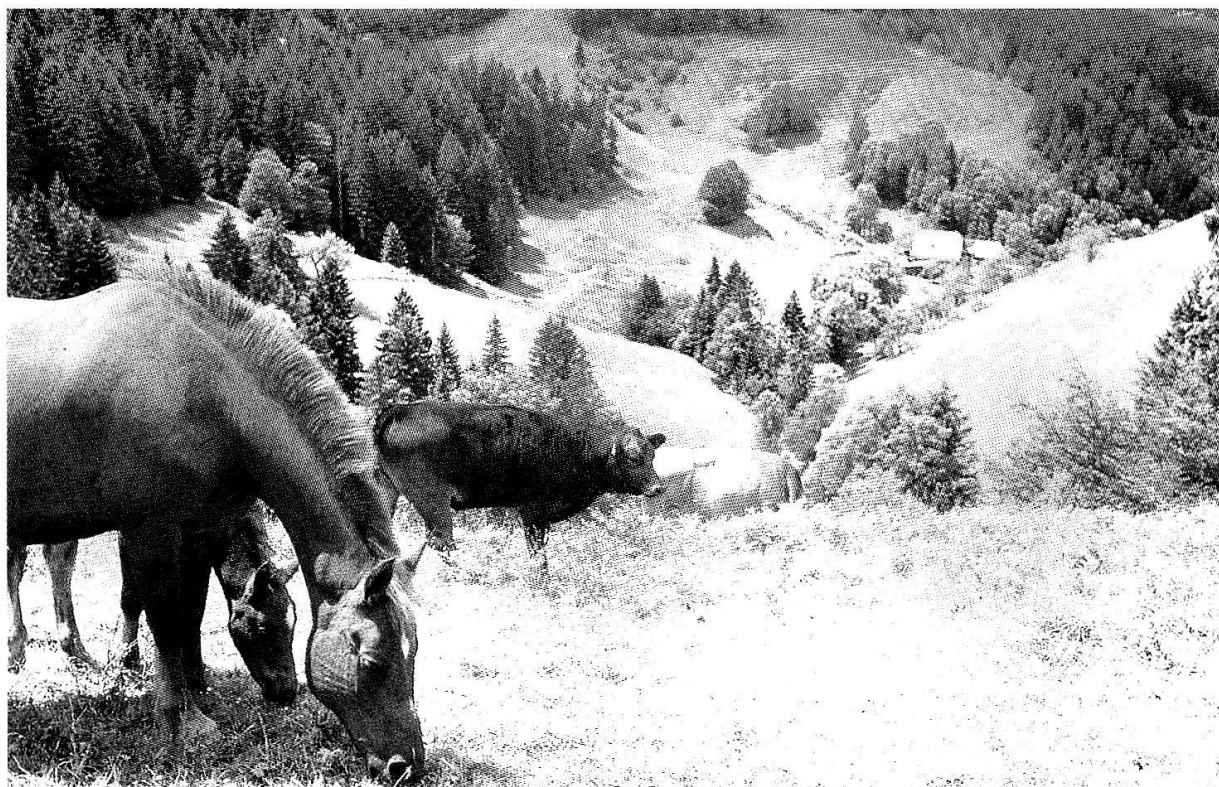
Abb. 3. Schutzgebiete, deren Schutzziele den Erhalt traditioneller Bewirtschaftungsformen voraussetzen, leiden oft unter der Nutzungsaufgabe. Mittels luftbildgestützten Zeitreihenanalysen auf gemeinsamer kartographischer Basis lassen sich Ausmass und Steuergrößen einer solchen Entwicklung analysieren. Die Landschafts-CD stellt hierzu mit luftbildtauglichen Kartierungsschlüsseln und einer GIS-Anbindung die nötigen Werkzeuge zur Verfügung. Napfgebiet, Photo: Thomas Coch.