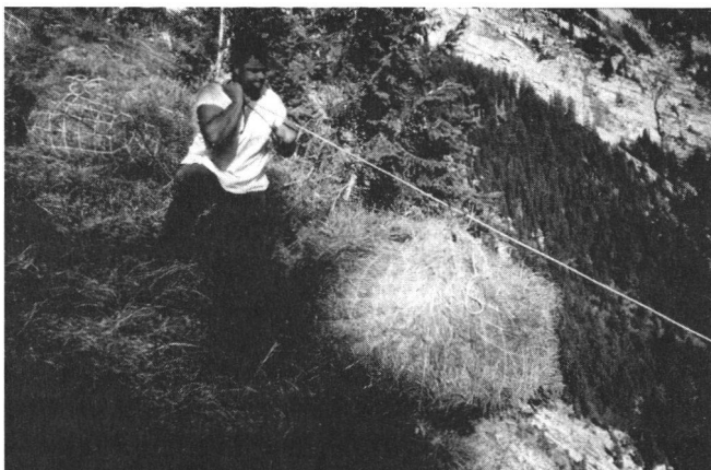
Fig. 2: Transport der Heuburdi mittels Heuseilen

Wann „ der Schiess aufgeht “ (das Bergheuen eröffnet wird) entscheidet der Bürgerrat, meistens ist dies in der ersten Augusthälfte. Nutzungsrechte am Bergheu sind seit über 300 Jahren klar geregelt. Dabei wird zwischen dem Schiessheurecht, das für alle Talbürger gilt und dem Hüttenheu-, Tasternheu- und Alpheurecht unterschieden. Letzteres gilt nur für die Alpgenossen und Alpbesetzer. Alpgenosse ist „ derjenige, der vom 10. März 1803 aufweisen kann, dass es damals ein angesessener Thalmann war oder vorher gewesen “ und Alptitel besitzt. Alle anderen werden als Ungenossen bezeichnet. Über die Nutzungsberechtigung wird selbst heute – da viel weniger Interesse am Bergeheuen besteht – noch streng gewacht. Die Busse für Alpvergehen beträgt seit 1939 Fr. 5.- pro „ Burdi “, wobei der Kläger einen angemessenen Klägerlohn erhält.