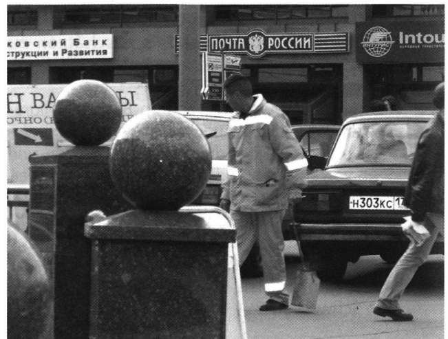
Abb. 1: Strassenreiniger aus Kirgistan in Moskau

Obwohl die in der Regel ohne Aufenthaltsbewilligung arbeitenden MigrantInnen aus Kirgistan kaum einen nationalen Mindestlohn erhalten, ist das Einkommen oft um ein Vielfaches höher als in Kirgistan. Die verrichteten Arbeiten sind in Russland vor allem im Reinigungsbereich, in Kasachstan und in der kirgisischen Hauptstadt Bishkek sind die MigrantInnen oft auch auf Märkten anzutreffen.