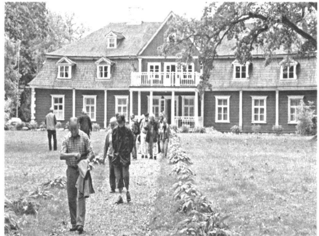
Abb. 3: Gutshof Ungurmuiza, Estland

das berühmte Grab der «Rose von Turaida», einer der zahllosen baltischen Legenden, besichtigten. Den Nachmittagstees genossen wir im Teepavillon des Guthofes Ungurmuiza (Orellen), der ganz aus Holz gebaut und als einziger aus dem 18. Jahrhundert noch erhalten ist. Bei Valga überquerten wir die lettisch-estnische Grenze, die mit dem Beitritt der baltischen Staaten zur EU im Jahr bedeutungslos geworden ist. Den Abend und die Nacht verbrachten wir am Pühajärve («Heiliger See»). Einige genossen noch ein Bad im See, andere zogen das neu erstellte Hallenbad vor!