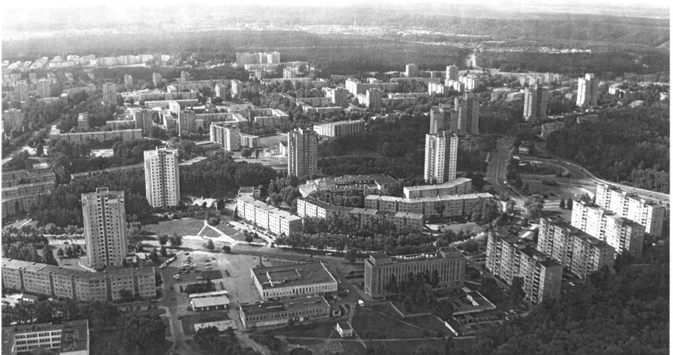
Abb. 1: Plattensiedlung Lazdinai in Vilnius

Der dritte Tag führte uns nach Trakai, der mittelalterlichen Burg der litauischen Grossfürsten, inmitten einer sehr schönen Seenlandschaft. Die Fahrt ging dann weiter über Kaunas, wo wir als erstes das Mittagessen im rustikalen, traditionellen Restaurant Zalias Ratas genossen und danach die Altstadt am Zusammenfluss von Neris und Nemunas (Memel) besichtigten. Gegen Abend trafen wir in der Hafenstadt Klaipeda, der ehemaligen ostpreussischen Stadt Memel am Kurischen Haff ein. Am Dienstag besichtigten wir zuerst die kleine Altstadt von Klaipeda mit dem Brunnen des Ännchens von Tharau und lernten anschliessend die Kurische Nehrung kennen, von der Wilhelm von Humboldt 1829 schrieb, «dass man sie ebenso gut wie Spanien und Italien gesehen haben muss, wenn einem nicht ein wunderbares Bild in der Seele fehlen soll.» Wir bestiegen die Grosse und die Tote Düne, besichtigen das ehemalige Fischerdorf Nida, lernten in einer Werkstatt den Bernstein und dessen Bearbeitung kennen und besuchten das Thomas Mann-Haus. Eine kurze Wanderung führte an die Ostseeküste, wo es sich einige nicht nehmen liessen, ein kühles Bad zu geniessen, rundete den Ausflug auf die Nehrung ab.