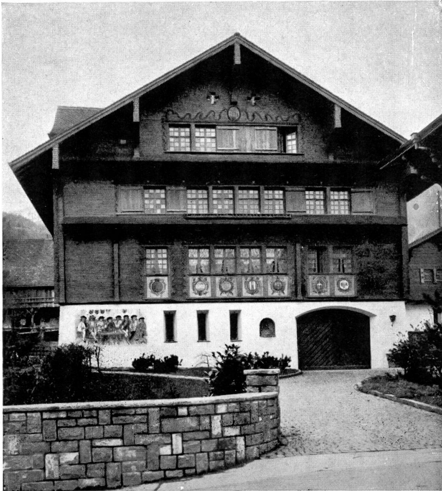
Das Ritter Stalder-Haus in seiner heutigen Gestalt