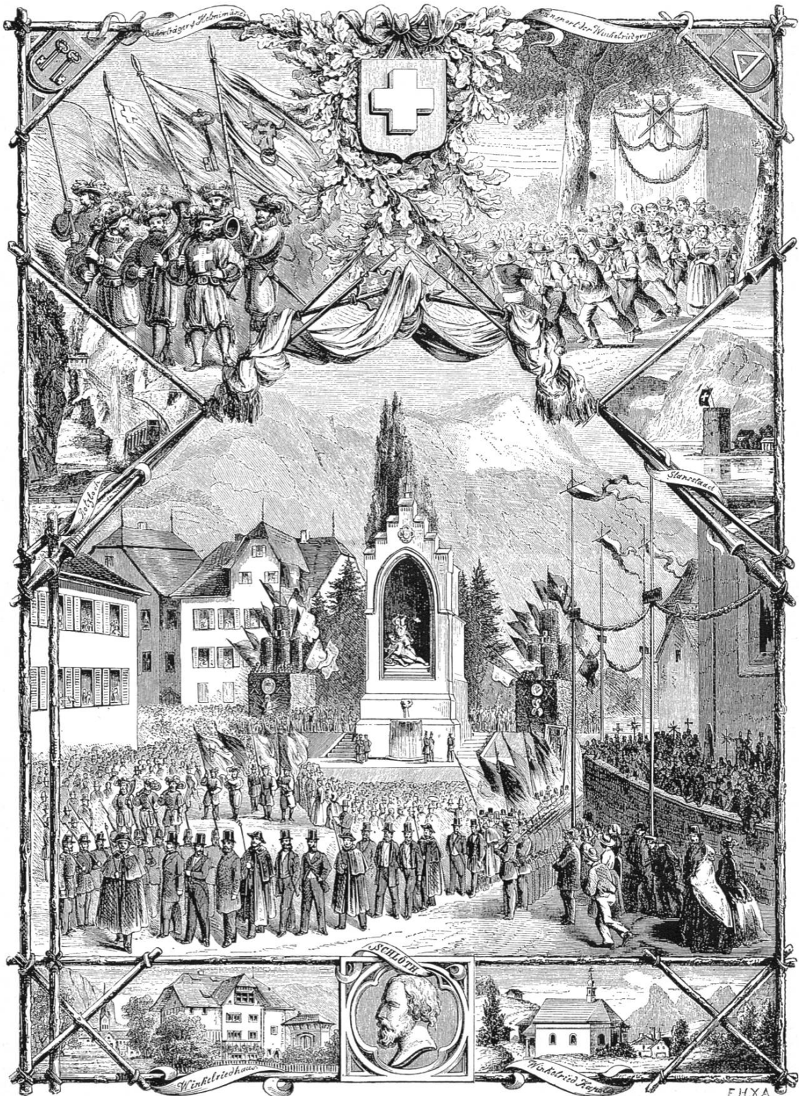
Die Enthüllung des Winfried-Denkmal in Stans am 3. September. Nach einer Originalzeichnung von H. Jenny. (S. 35.)