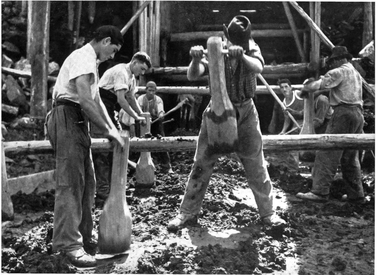
Jede Rollwagenladung wird mit Hilfe von Holzstößeln eingestampft, um einen kompakten Lehmkern zu erhalten (siehe S. 218).