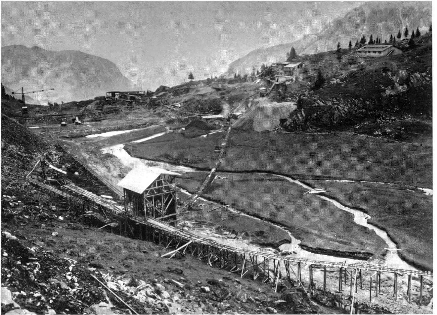
Rollbahn für den Lehmtransport zum Staudamm. In der Bildmitte die Mischanlage, wo der Lehm mit Kies durchsetzt wurde (siehe S. 218).