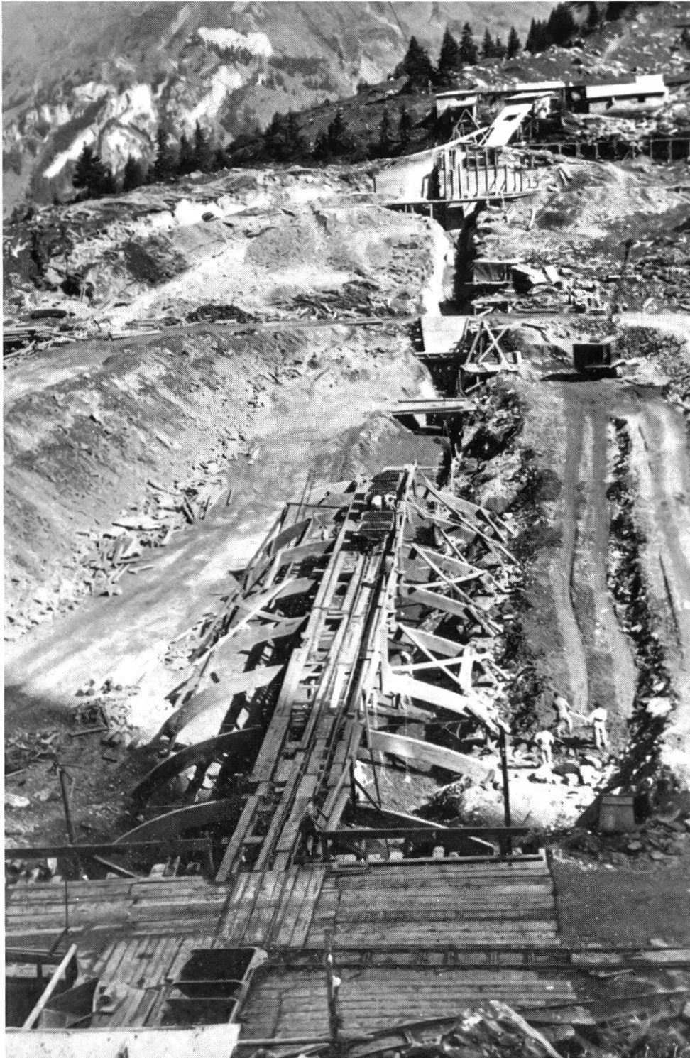
Übersicht über die Baustelle im Bereich des Staudammes. Unterhalb der Bildmitte ist die Holzspriessung zu erkennen, auf der einige Rollwagen stehen, die den Lehm in den vorbereiteten Graben kippen.