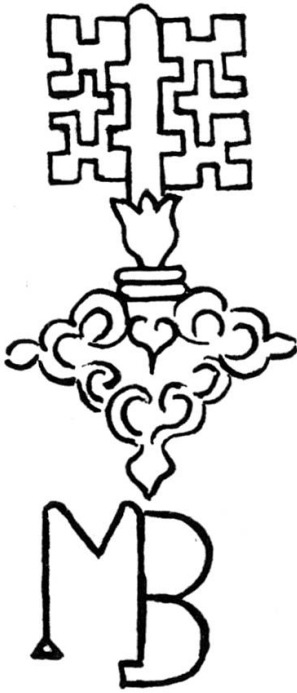
Wasserzeichen Rotzloch. Erkennbar am Nidwaldnerschlüssel. Kopiert durch P. Ignaz Hess und nach seiner Angabe von einem im Jahre 1600 beschriebenen Schriftstück stammend. In diesem Falle deuten die Initialen MB auf M(eister) B(orsinger).