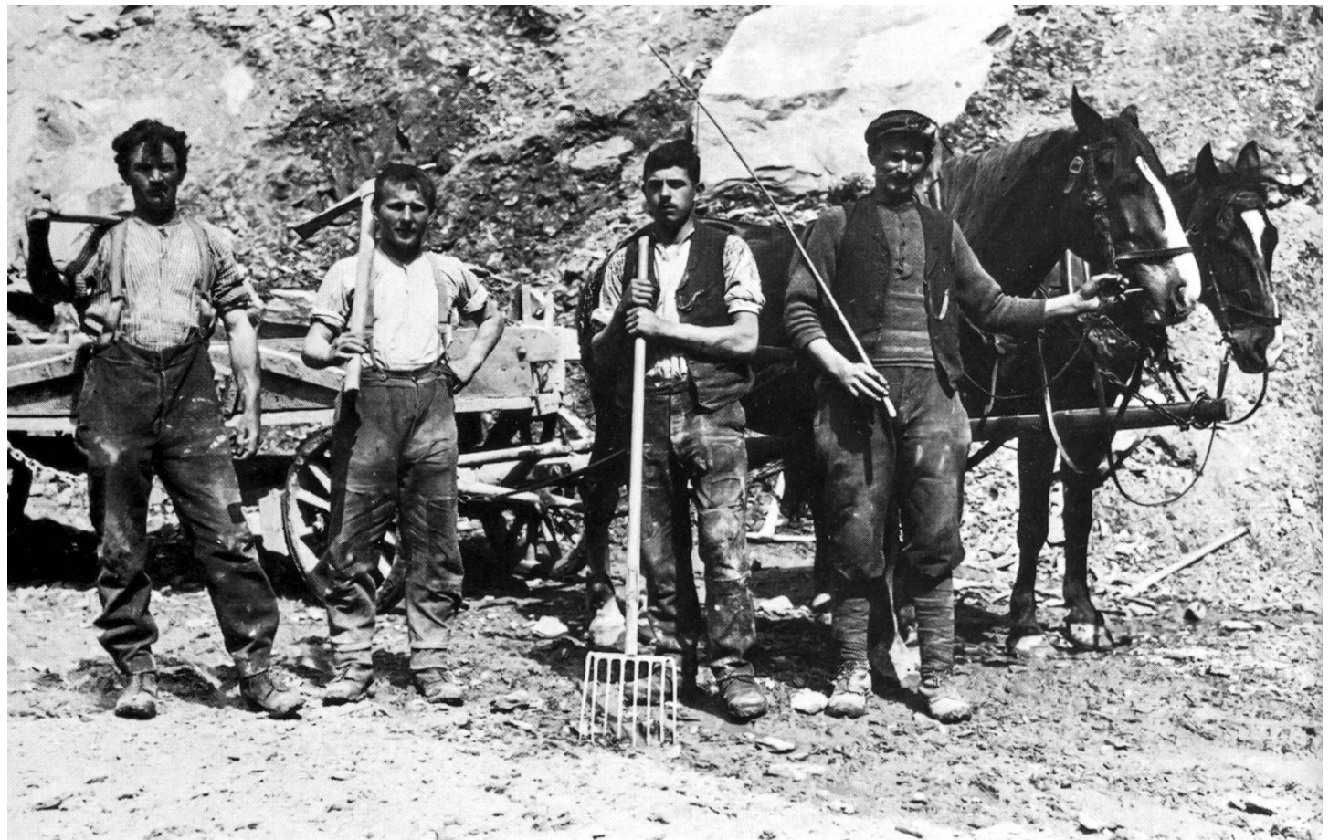
Mir Fuhrwerken wurde das im Stollen gewonnene Material zum Brecher gebracht. Aufnahme ca. 1895.

im Rotzloch von den 140 Arbeitern täglich 1000 Zentner Zement und Kalk hergestellt worden sein. 7