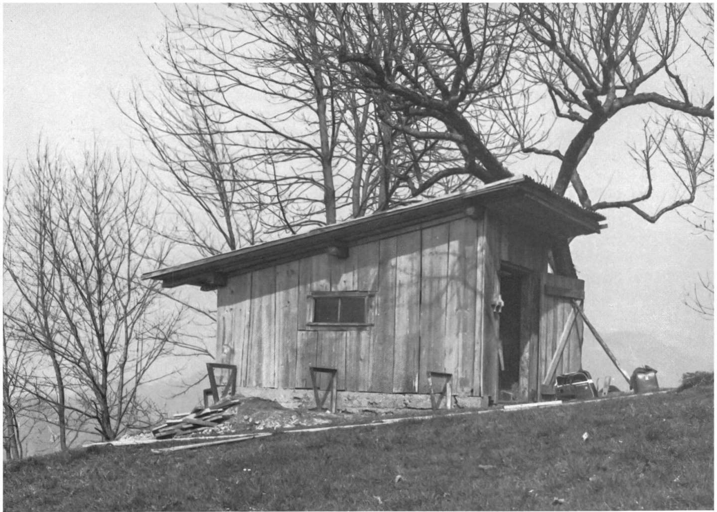
Fundstelle des Skelettes.

Kanthölzer werden von senkrecht in den Boden gerammten Pfählen gehalten. Der Elektromotor steht auf einem quadratischen Betonsockel in der Nordwestecke des Hüttchens. An der Aussenseite der Westwand sollte nun im Frühjahr 1971 eine Sitzbank errichtet werden. Für deren Sockel hob man drei Fundamentgruben aus. Der Zufall wollte es, dass mit der talseitigen Grube die Beinknochen eines Ost-West gerichteten (Kopf im Osten) Skelettes angeschnitten wurden. Die Entdecker stellten fest, dass die Knochen unter das Fundament des Schopfes liefen. Sie stellten die Arbeiten ein und schütteten die Grube zum Schutze des Skelettes wieder zu. Dank dieser überlegten und beispielhaften Reaktion blieb das Skelett für die fachgerechte Untersuchung im Fundzustand.