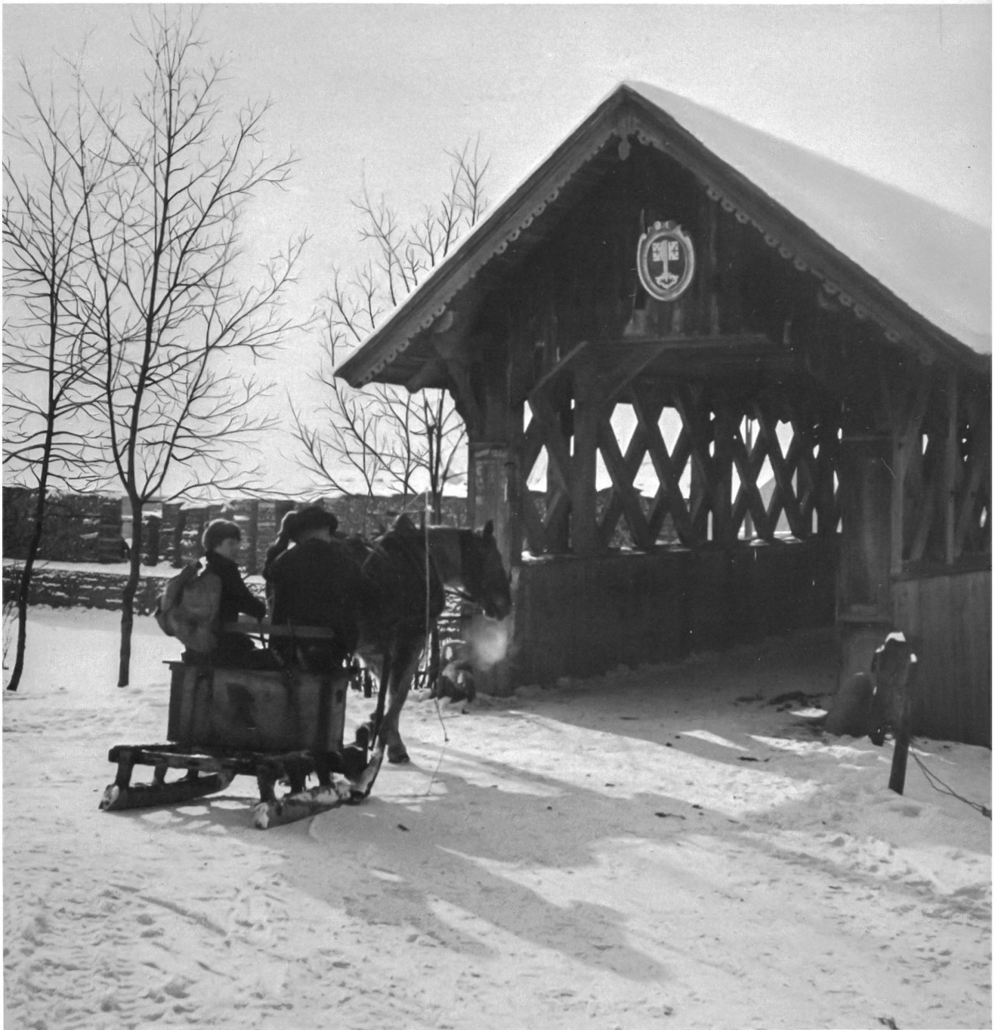
12 Eine Fahrt ins Dorf zum Handel oder zu einem Handwerker war vor dem Aufkommen des privaten Verkehrs für die Bauern auf den Streusiedlungen ein Ereignis, das mindestens einen halben Tag beanspruchte. Im Winter war der Pferdeschlitten auf den schneebedeckten Wegen ein ideales Fuhrwerk. Von Buochs bis Wolfenschiessen boten viele hölzerne Brücken Übergänge über die Engalbergeraas. Die abgebildete Aabücke bei Wil war 1882 erneuert worden. Die ältere Brücke hatte an einem Tragbalken des Daches die Jahrzahl 1544 eingeschnitzt. Die Holzbrücke ist 1969 durch eine Betonbrücke ersetzt worden. Aufnahme vom Winter 1938/39.