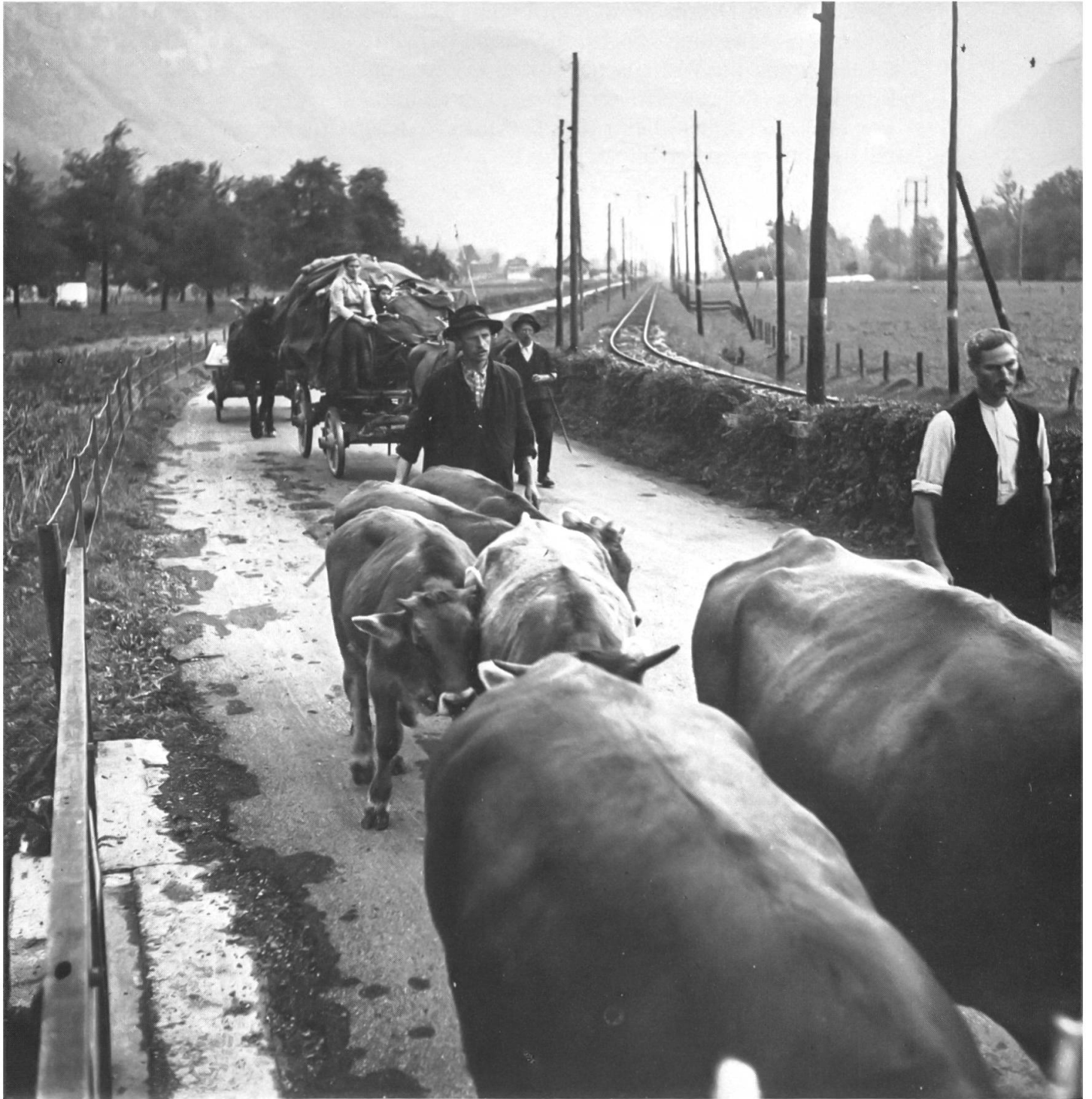
9 Alpaufzug und Alpabfahrt waren neben Äplerhilbi und Viehzeichnung die Grossereignisse im bäuerlichen Jahresablauf. Infolge der weitgehenden Erschliessung der Alpen mit Strassen und der grossen Gefährdung von Menschen und Vieh durch den Verkehr werden die Sennten heute grösstenteils motortransportiert. Das Bild zeigt den Schluss des Sennten der Familie Odermatt-Niederberger von der Alp Arni Wang, im September 1945. Die noch schmale Strasse von der Lochrütikurve nach Wolfenschiessen ist beidseitig mit einem Buschgehege gesäumt.