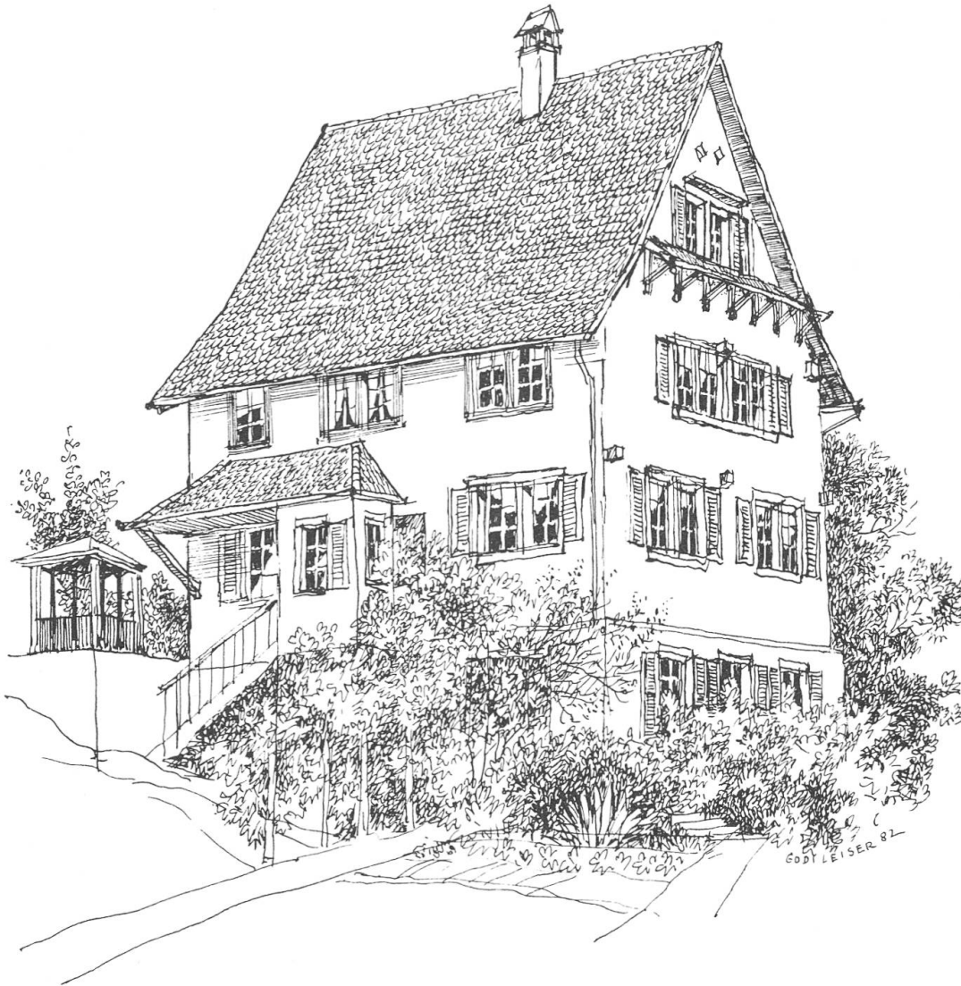
5 Die Frühmesserei, erbaut im Jahre 1686, ein hochgiebeliger Riegelbau. Zur Originalität des Bauwerks tragen die unterschiedlich zusammengefassten Fensterreihen und das Klebedach bei.

und der Stanser Kirchgenossen. Im Jahre 1686 wurde das Haus des Frühmessers erbaut. Gleichzeitig erscheint auch der erste Inhaber der Stiftung 5 :