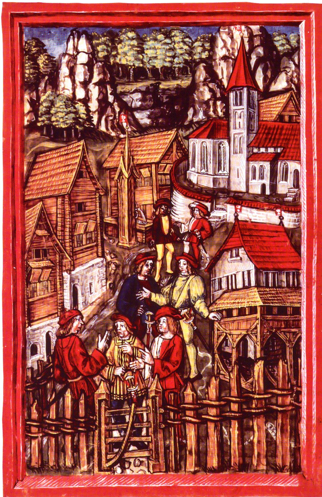
5 Der Tagsatzungsort Stans im 15. Jahrhundert. Illustration aus: Schweizer Bilder-Chronik des Luzerner Diebold Schilling.