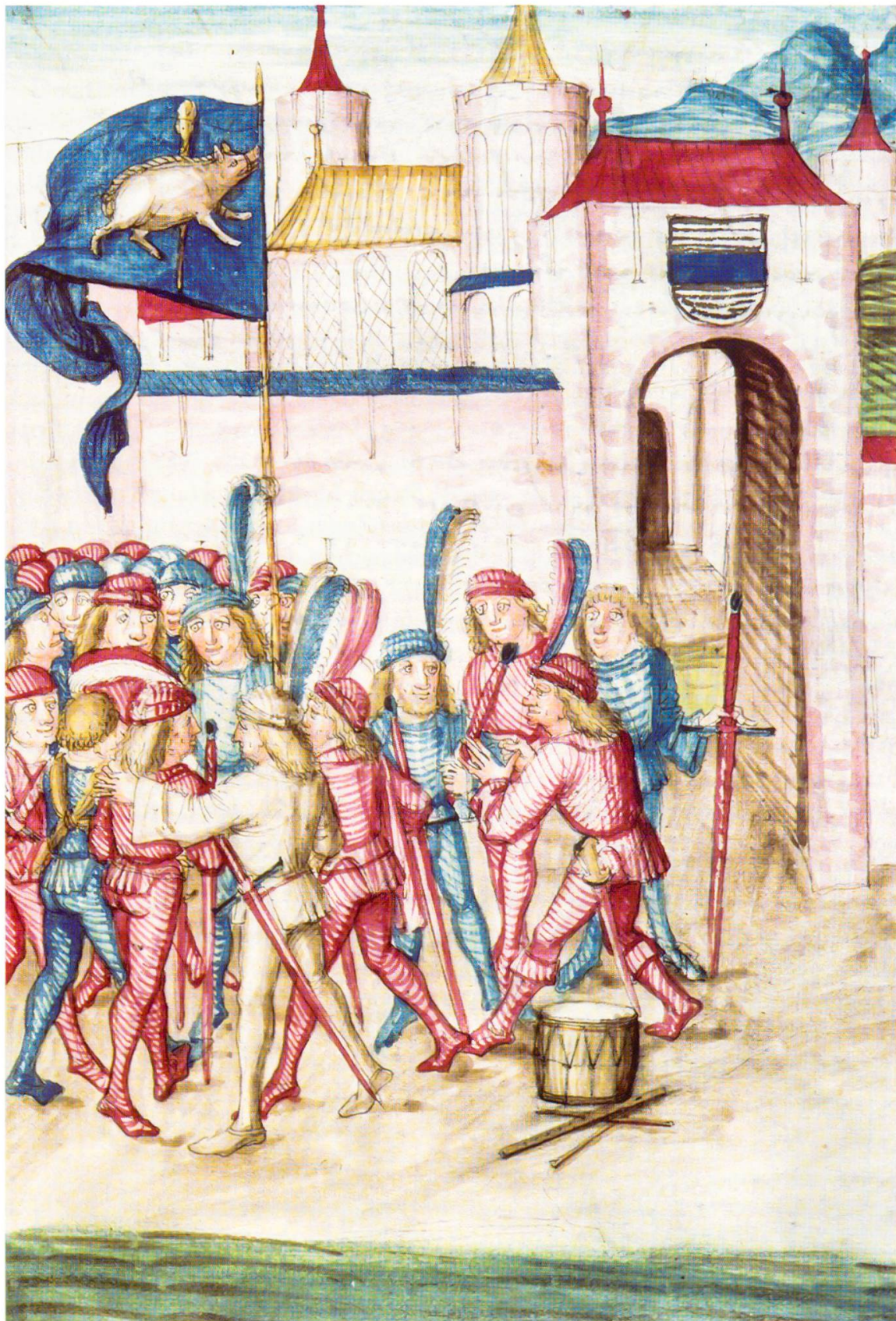
3 Die Besammlung der Gesellen im «torechtigen Leben» vor Zug. Detail aus einer Illustration aus der amtlichen Ausgabe der Berner Chronik des Diebold Schilling (Hs. B).