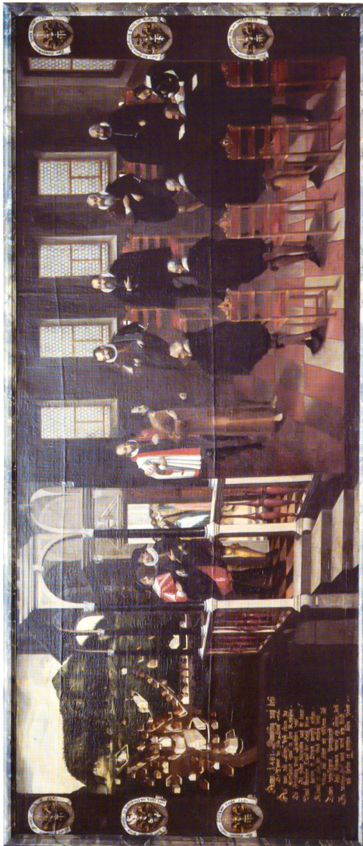
36 Bruder Klaus als Friedensvermittler vor den Tagsatzungsboten in Stans. Ölgemälde von 1650 im Rathaus zu Stans.