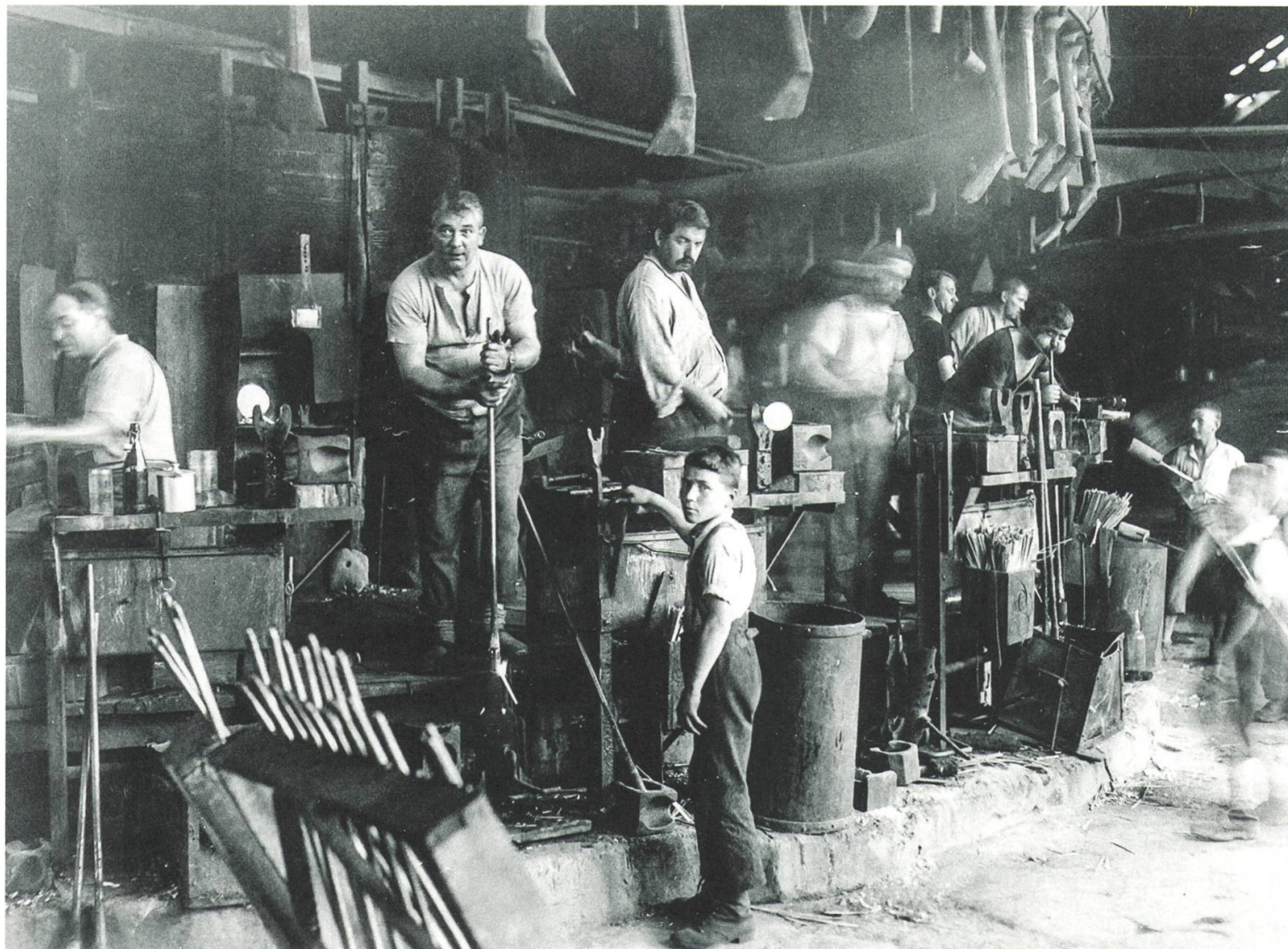
In der Hergiswiler Glasi waren während des Ersten Weltkriegs neben Facharbeitern (Glasbläsern) und Hilfsarbeitern auch Jugendliche beschäftigt. Sie ersetzten die Arbeiter, die Aktivdienst leisteten und deshalb am Arbeitsplatz fehlten.

waren Extremsituationen für zahlreiche Familien (siehe Artikel Huber und Krämer). Vor allem in den Städten war die Not der einfachen Bevölkerung gross. Die Behörden waren überfordert und schienen hilflos. Gleichzeitig machten Unternehmen und Patrons teilweise riesige Gewinne: «Skrupellose Kriegsgewinnler und Spekulanten stellten vorab in den Städten ihren Wohlstand offen zur Schau, was die Erbitterung weiter Bevölkerungskreise zusätzlich steigerte.» 42 Die Gegensätze zwischen Bürgertum und Arbeiterschaft und auch zwi-