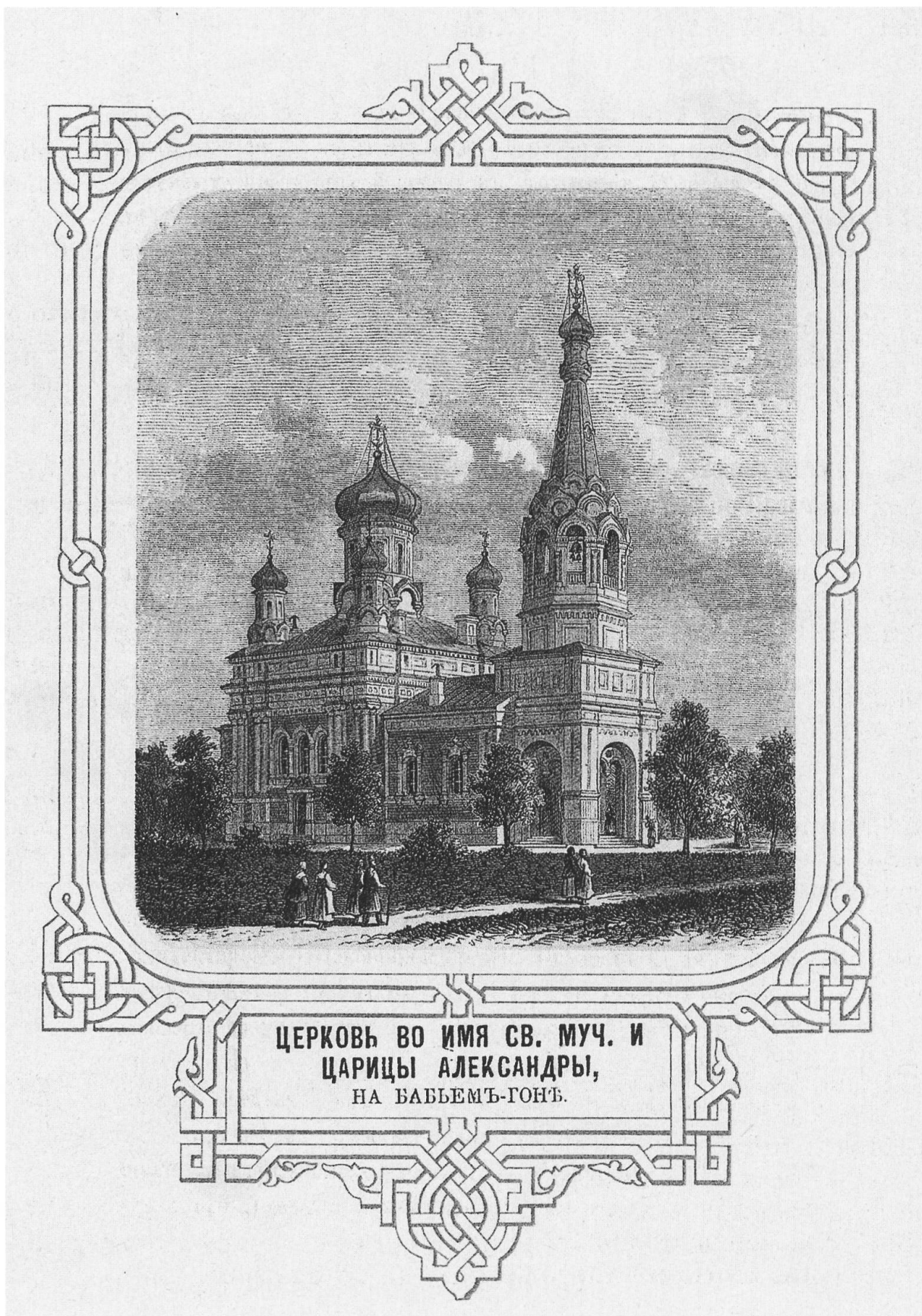
ЦЕРКОВЬ ВО ИМЯ СВ. МУЧ. И ЦАРИЦЫ АЛЕКСАНДРЫ, НА БАБЬЕМЪ-ГОРЬ.

Peterhof. Chiesa della Santa Martire Alessandra sulla collina Babigonje. Estratto da A. Gejrot, Opisanie Petergofa , Sankt Peterburg, 1868. Ristampa 1991.