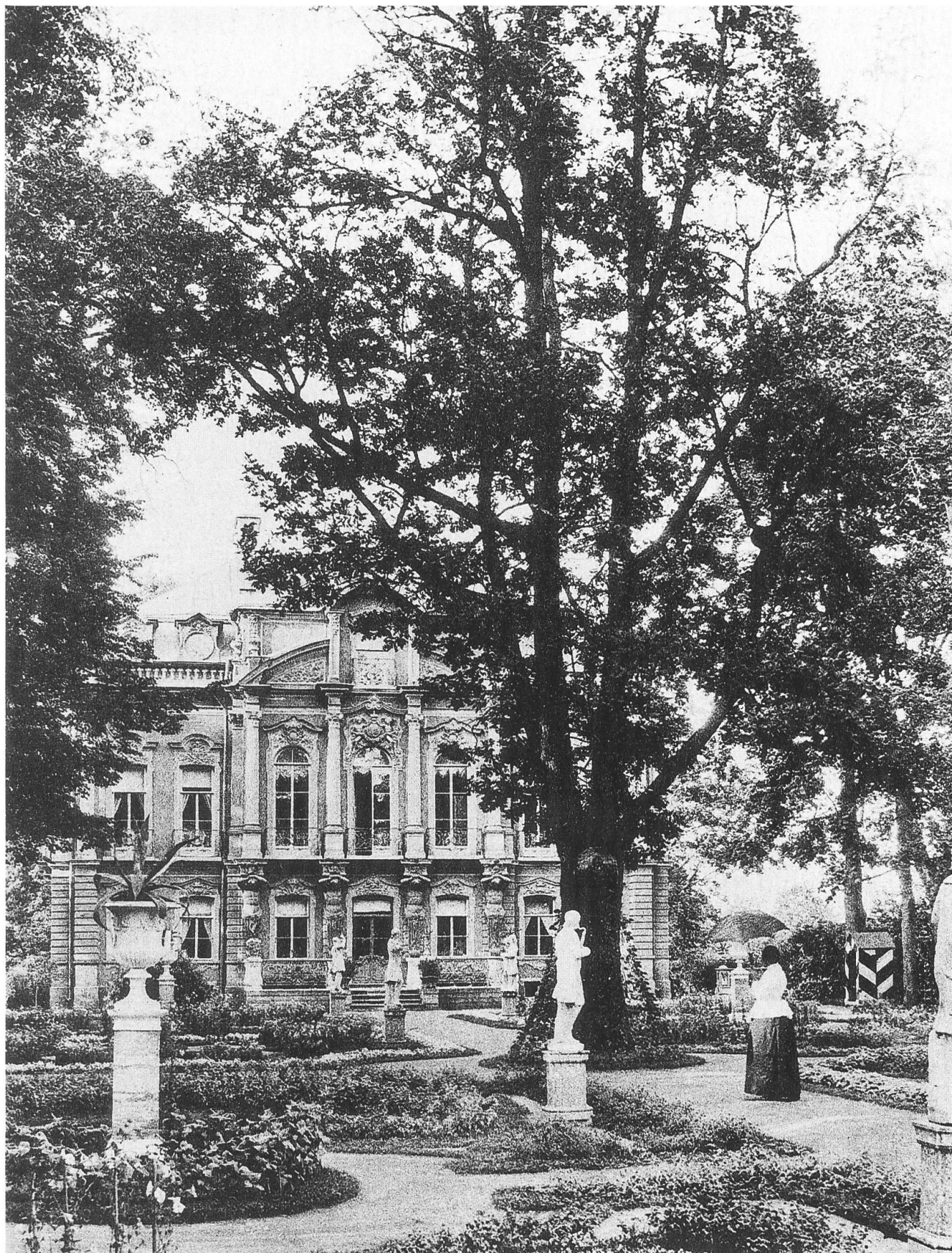
Peterhof. Dacia privata imperiale nel parco, sulla strada Peterhof-Oranienbaum. Archivio fotografico dell'Istituto per la Storia della Cultura Materiale, presso l'Accademia Russa delle Scienze (IIMK RAN). San Pietroburgo. Foto di E. P. Visnjakov, 1894.