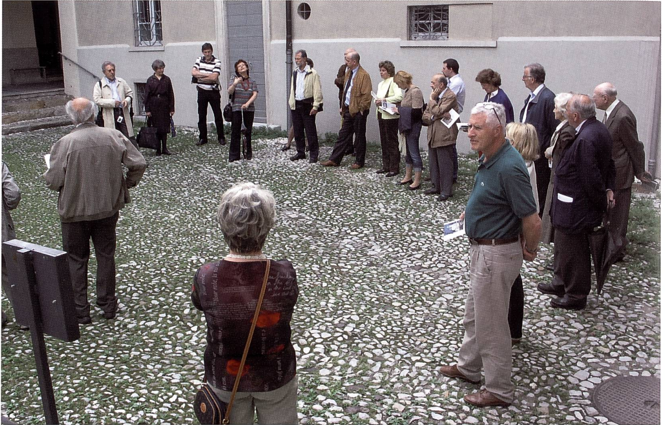
Alcuni dei partecipanti all'assemblea di Riva San Vitale del 31 maggio 2008