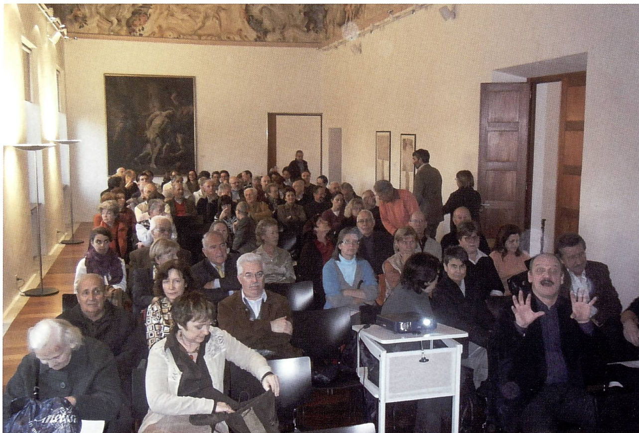
Due immagini del pomeriggio genealogico a Balerna del 15 novembre 2008