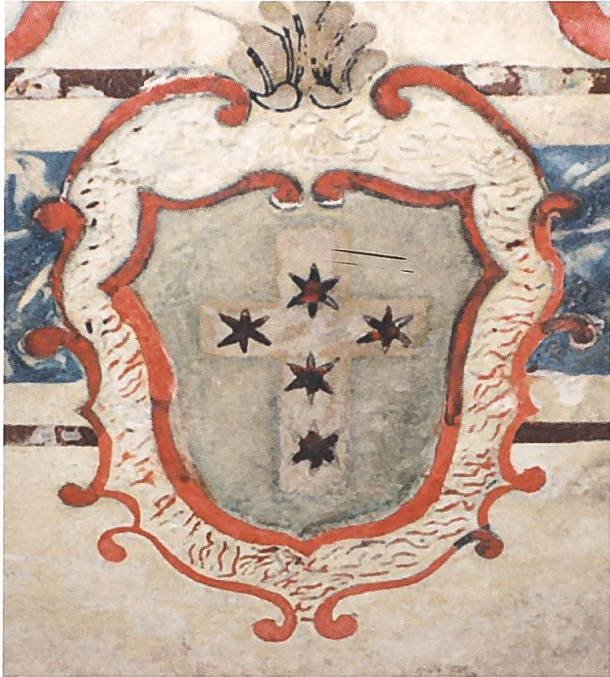
Lo stemmi della famiglia Antognini come appare su di un altare nell'Oratorio di San Rocco a Vairano (XVII sec.).

Dominici Antognini». 5 L'ipotesi dell'arrivo in Ticino da Milano dopo il 1630 non sembra dunque reggere. Per questo motivo sarebbe necessario un approfondimento più rigoroso su questo problema, che tenga conto delle questioni sollevate, valutando nuove ipotesi di ricerca. Prudentemente il Lienhard-Riva segnala gli Antognini solo come famiglia «oriunda di Vairano», ascritta alle Vicinie di Vira Gambarogno, Magadino e Bellinzona.