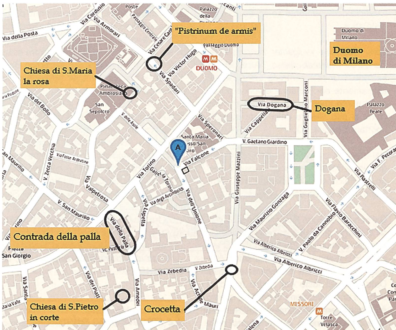
Immagine parziale della mappa della Milano odierna.

quale non era consentito aprire nuove attività commerciali concorrenti con quella dell'Albergo del Falcone.