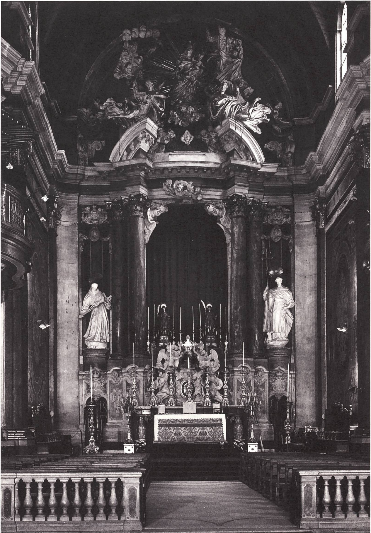
Cappella principale della Chiesa di San Domenico, Lisbona (prima dell'incendio del 1959). João Frederico Ludovice (architetto) e Giovanni Antonio Bellini (scultore), 1748.