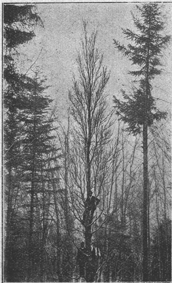
Fig. 2. Die Pyramiden-Buche von Laupersdorf, Ct. Solothurn.

Anfänglich nach der Entdeckung, vor ca. 25 Jahren, waren 4 Exemplare vorhanden, die räumlich ziemlich weit auseinander standen; leider wurden zwei davon bei einer Durchforstung weggehauen von den Arbeitern, die nicht genügend instruiert waren, und das dritte Exemplar war in dem dichten Bestand bis jetzt nicht mehr auffindbar.» (76)