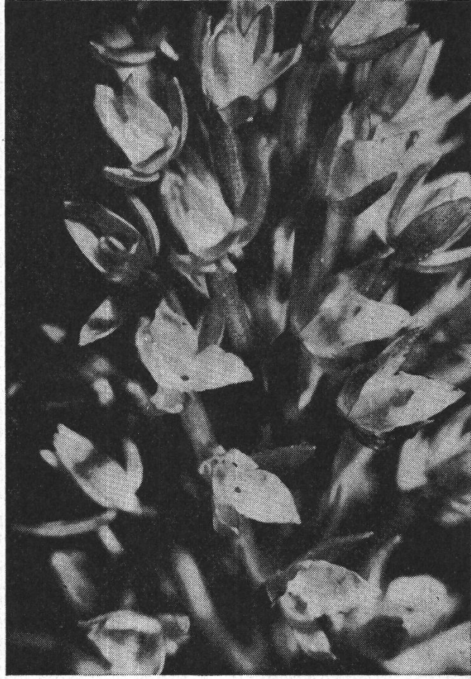
Abbildungen 2 und 3

Gymnanacamptis odoratissima Wildhaber vor dem Aufblühen und Blick in die voll erblühte Pflanze