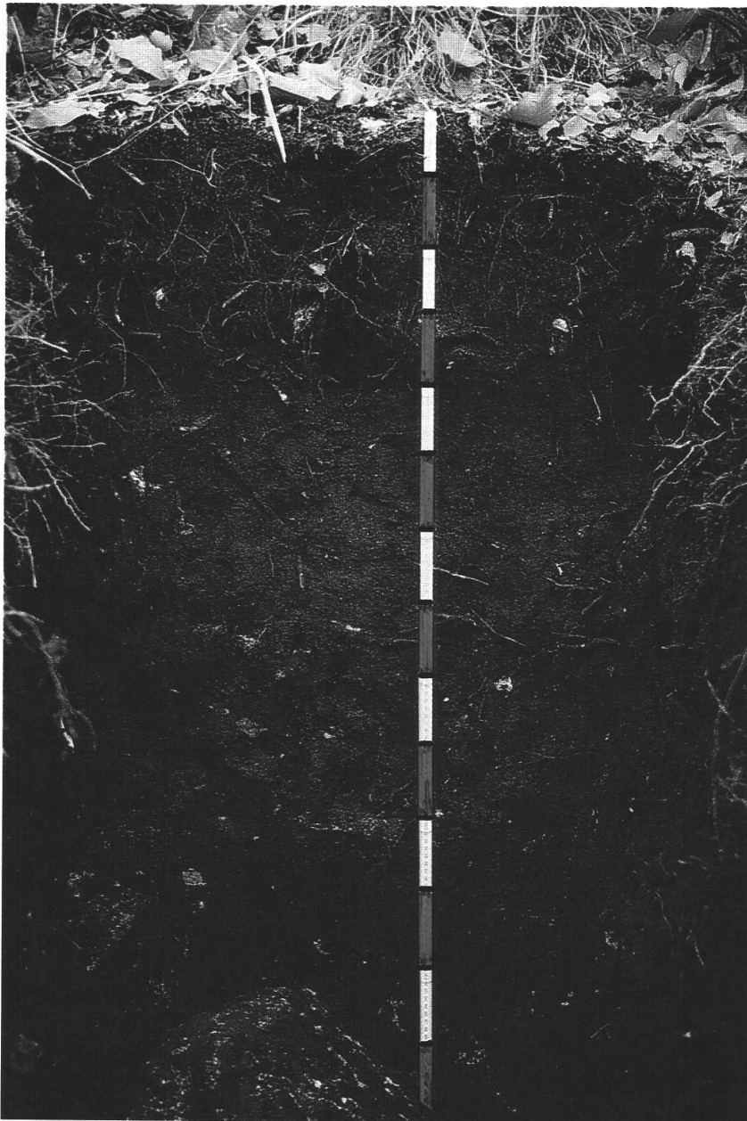
Abb. 1. Bodenprofil. Aufgrund von Charakterisierungsmerkmalen und chemischen Analysen als Kryptopodsol zu bezeichnen (Blaser 1973). Die Markierungen auf dem Doppelmeter betragen jeweils 10 cm. Weitere Angaben im Text.

Ob die Holzkohlen in Stamm, Borke, Zweigen oder Wurzeln lokalisiert waren, lässt sich in genügend großen Fragmenten auf Grund anatomischer Differenzierungsmerkmale in den verschiedenen Pflanzenorganen nachweisen. Stamm- und Astholz ist holzanatomisch in den wenigsten Fällen mit absoluter Sicherheit unterscheidbar: Der Krümmungsradius von Jahrringen kann Hinweise liefern, da dieser in den meist dünneren Ästen größer ist als in dickeren Stämmen. In kernnahen Stammregionen und bei jungen Bäumen jedoch versagt dieses Vorgehen. Wo in Tab. 1 nicht anders vermerkt, kann es sich sowohl um Stamm- wie auch um Astholz handeln (s. Diskussion).