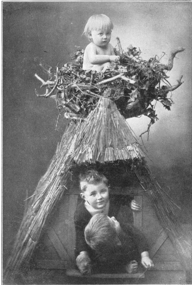
Der Storch hat's gebracht