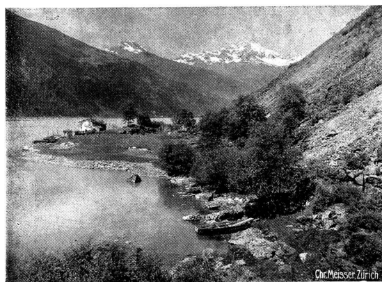
Puschlavensee mit Piz Verona

Zu reich beinahe überfluten die erhabenen Landschaftsbilder den Reisenden von heute, als daß ihnen ein einzige Fahrt allein gerecht werden könnte, und niemand darf sich rühmen, die Route zu kennen, der nur ein einziges Mal von St. Moritz nach Tirano ge- reist ist.