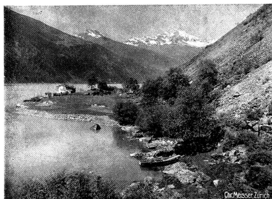
Puschlavensee mit Piz Verona

Dichte Haine kräftiger Kastanien beschatten einladende Grasplätze, Weizenfelder ziehen goldene Linien ins Gelände, in der Talebene aber ragt, ein Bild satten Überflusses, Maispflanze an Maispflanze, und Maulbeer- und Feigenbäume finden sich in Menge in der Nähe