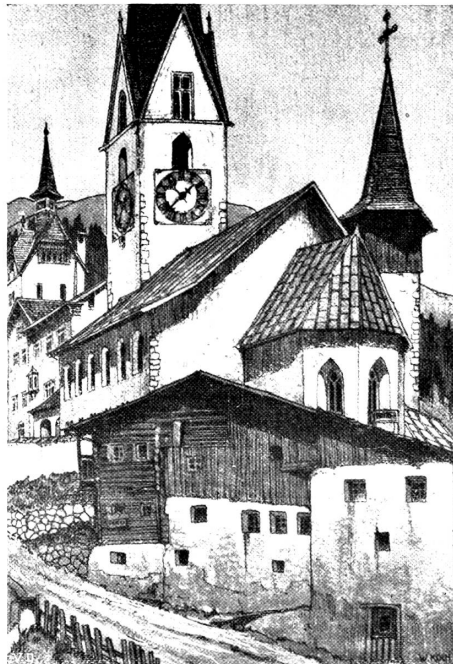
Kirche St. Johann, Davos

Die bösen Folgen der vielen Festlichkeiten führten dazu, daß die Regierungen bald auch den Kirchweihen zu Leibe gingen, die schon dadurch verderblich wurden, weil sie über das ganze Jahr verteilt waren und infolgedessen den benachbarten Dorfbewohnern Gelegenheit zu gegenseitigen Besuchen boten, bei denen blutige Raufereien dem fröhlichen Treiben nicht selten ein schlimmes Ende bereiteten. Allein diese Feste waren im Volke so tief eingewurzelt, daß es nur ungerne darauf verzichtete. Da z. B. die Regierung im Kanton Zürich mit der Abschaffung ernst machte, liefen die