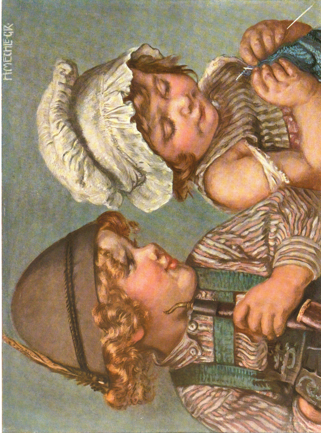
Nach dem Gemälde von H. Mechie-Großmann