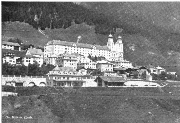
Das Kloster Disentis

Wir gingen in einen ungestörten Nebenraum und die schöne Tänzerin erzählte: