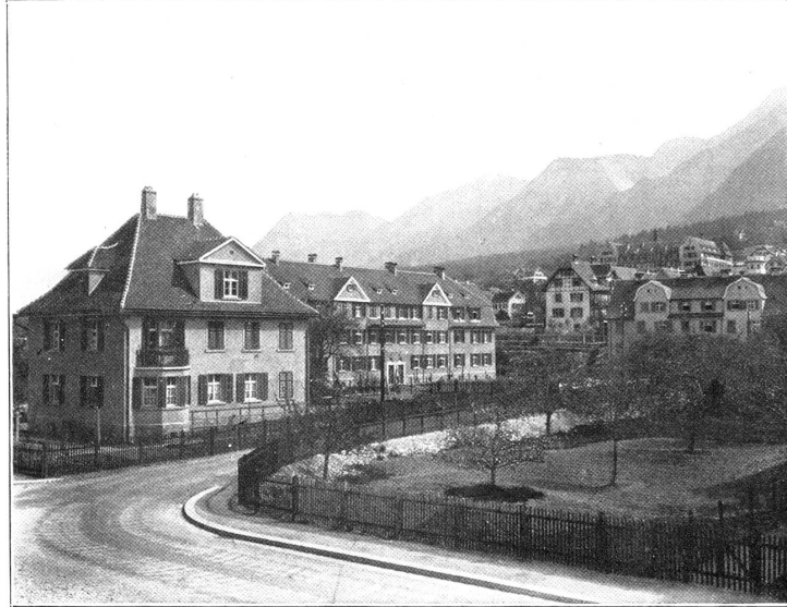
BLICK AUF DEN HEIMPLATZ