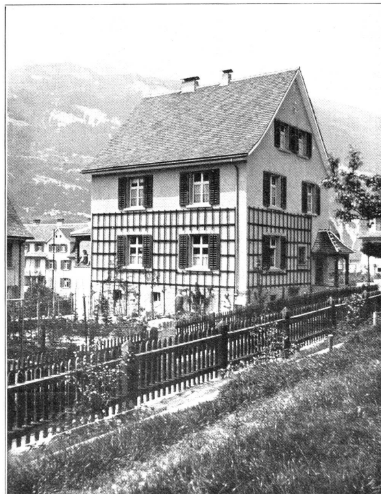
HAUS TYP. Ia AN DER SCHÖNBERGSTRASSE