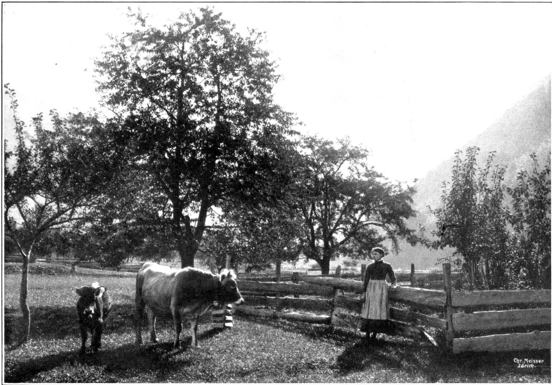
HERBSTWEIDE BEI SCHIERS