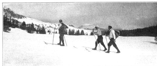
SKILAUFER BEIM AUFSTIEG

Die Rückfahrt nach der Stadt durch die winterliche, tief verschneite Landschaft, durch die freundlichen, hellbeleuchteten Ortschaften, bildet einen schönen Abschluß des Festes.