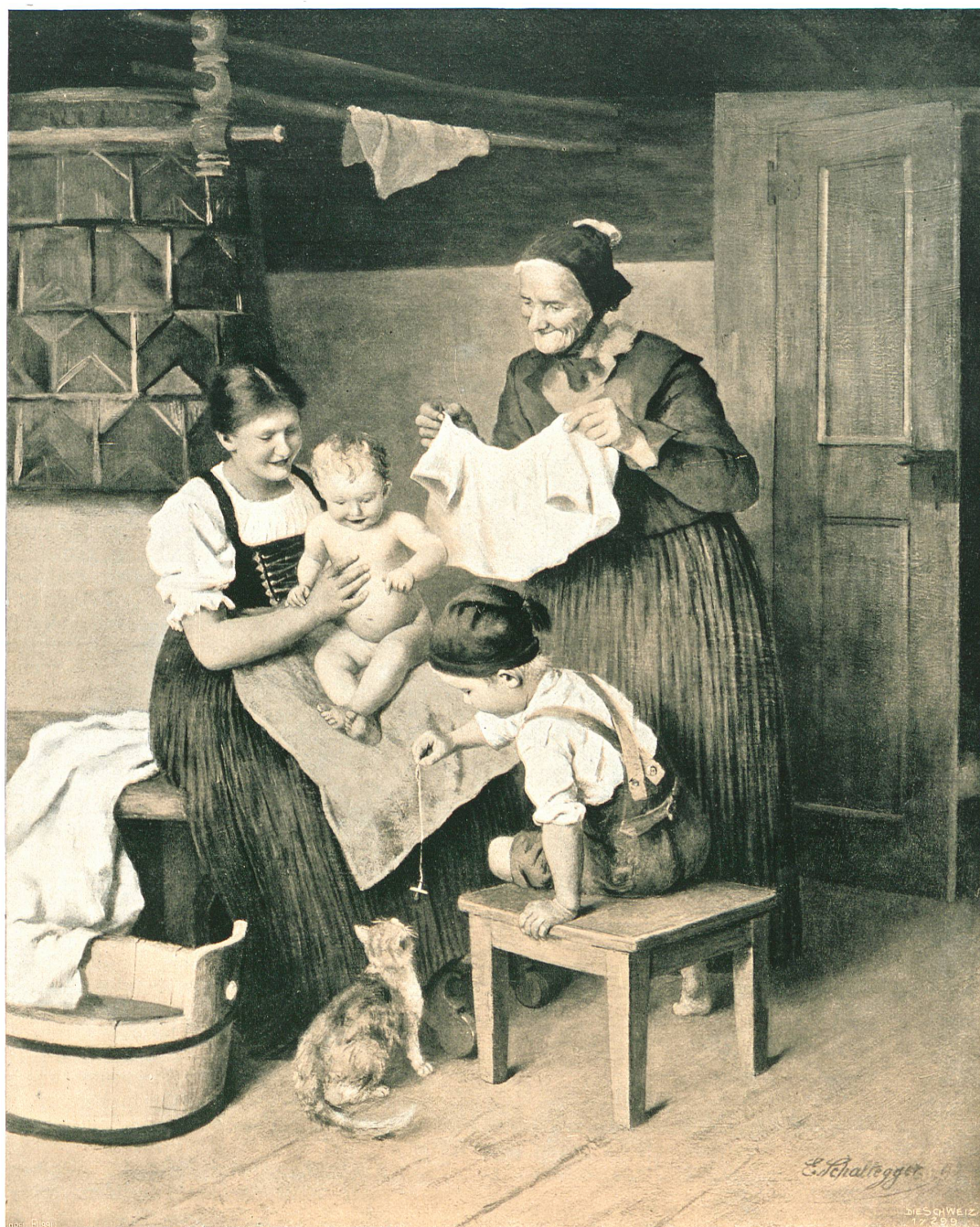
NACH DEM BADE (nach einem Gemälde von E. Schaltegger) Duplex-Autotypie