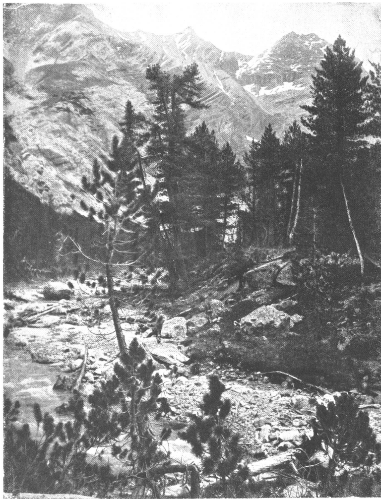
Partie des Nationalparkes im Unterengadin. Im Hintergrund des Val Cluozza.

Boden, und auf der folgenden, vom Bache angeschnittenen Schuttstrecke blühen liebliche Alpenblumen die Menge. Dann folgen am Fuße der Lawinenhänge auch die Gegenbilder des Waldlebens und seiner ungehinderten Verjüngung: strichweise von Lawinen und Schneerutschungen niedergelegte, in den Boden gedrückte Lärchen, Arven und Legföhren am Bachrand unter der Schutterasse. Wir schreiten über Trümmer- und Geschiebeschutt und spärlich bewaldete Flächen zum Ausgang der öden Val Sassa , wo ein mächtiger Schneeschild uns die Passage des höher oben unter endlosem Schutte verborgen rinnenden Baches erleichtert; das Brücklein vorn war weggerissen und wir mußten auf die rechte Seite der Val Sassa -Mündung setzen.