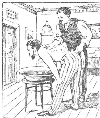
Tägliche Rückenwaschungen mit Grolichs Heublumenseife fördern die Lungentätigkeit.

Und gemsenartig auf Bergeshöhn Belustigt er sich umherzusehn In Freiheitsluft erquickt alsdann, Verhöhnt er Kind und Weib und Mann, Die tief in Tales Dampf und Rauch Behaglich meinen, sie lebten auch Da ihm doch rein und ungestört Die Welt dort oben allein gehört!