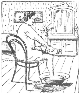
:: Tägliche Fußwaschungen mit :: Grolichs Heublumenseife fördern die Hauttätigkeit und Blutzirkulation und verhindern dadurch Fußschweiß und kalte Füße.