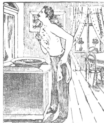
Tägliche Brustwaschungen mit Grolichs Heublumenseife fördern die Lungentätigkeit.