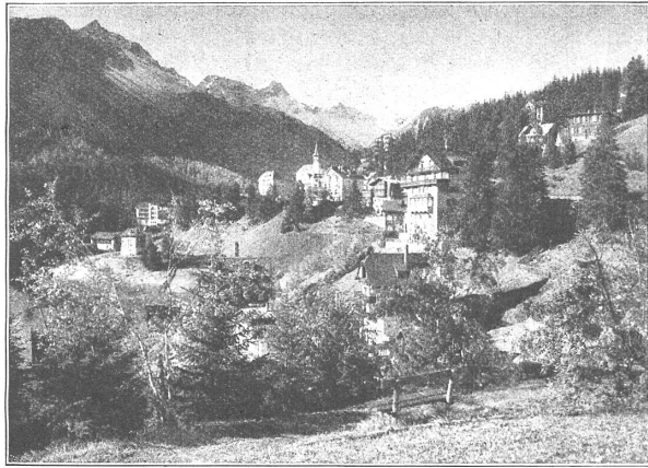
SOMMER IN AROSA