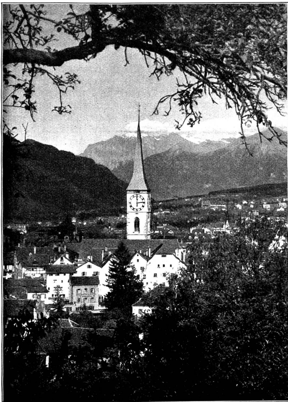
CHUR GEGEN DEN FALKNIS