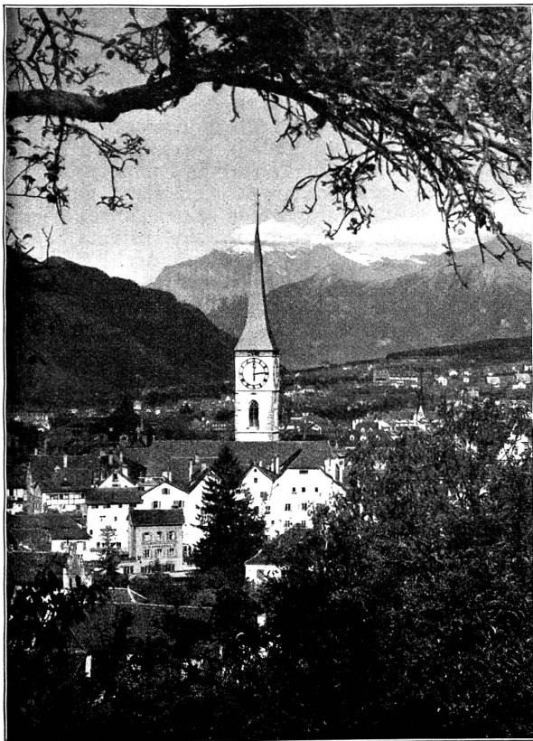
CHUR GEGEN DEN FALKNIS