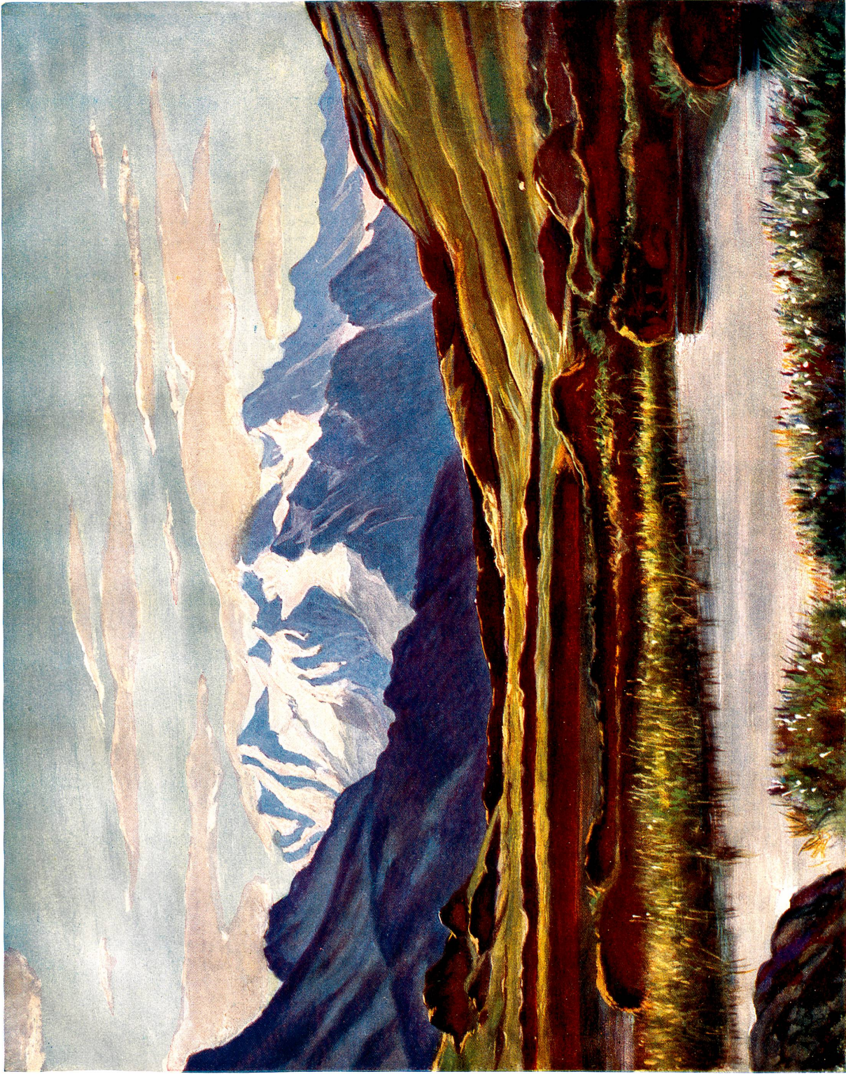
Nach einem Gemälde von A. A. Haas Kunstmaler, Basel