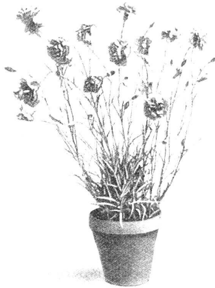
EINJÄHRIGE CHABAUDNELKE in voller Blüte

Möge also in unserem Bündner Volke die Liebe zu den Nelken stets wachsen, so daß diese Blume immer mehr werde, was sie heute schon ist, die eigentliche Nationalblume Graubündens.