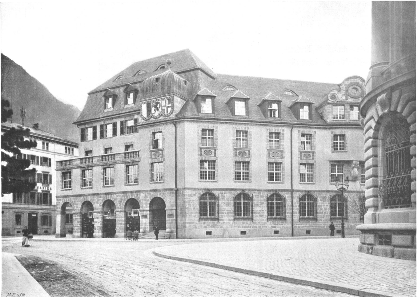
Graubündner Kantonalbank Chur