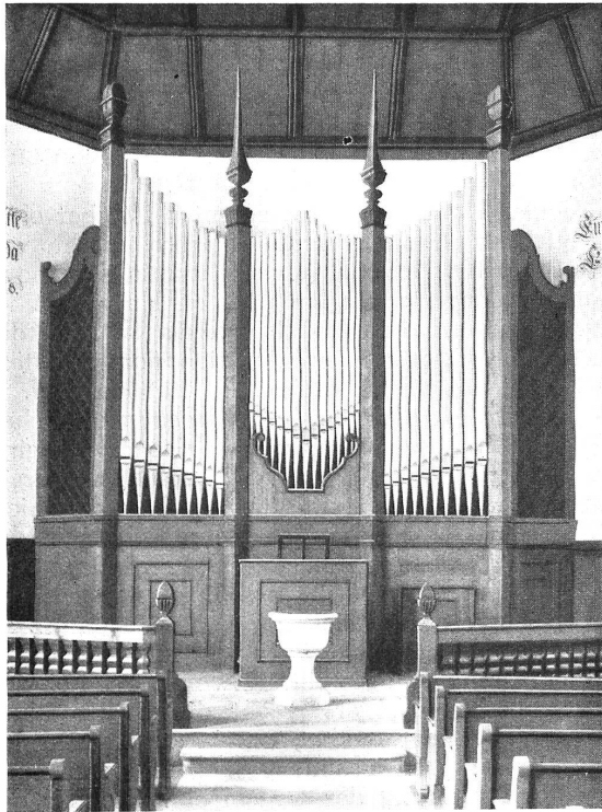
Die neue Orgel in der Kirche von Haldenstein Entwurf von Schäfer & Risch' Orgelbau Metzler & Co.