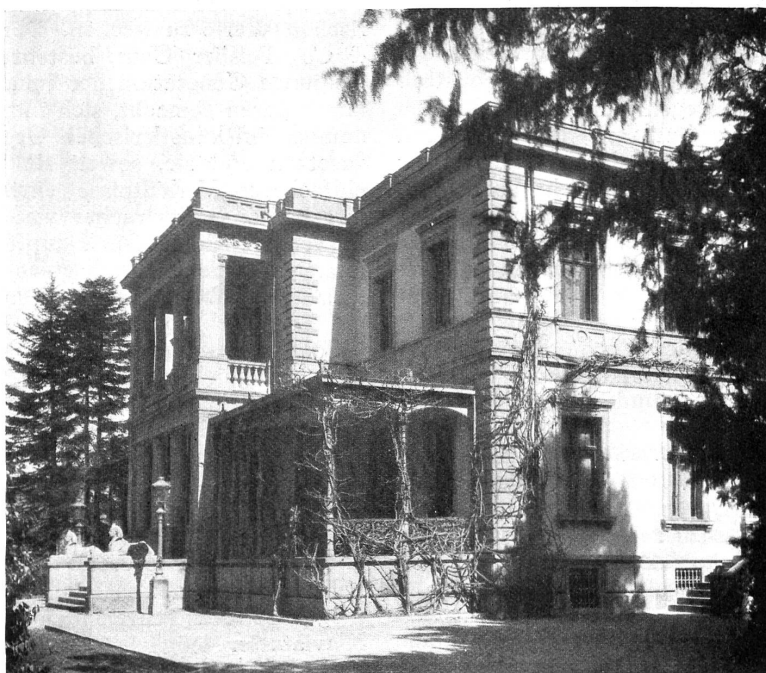
Kunsthaus Chur: Außenansicht