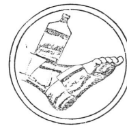
Bandagen in Gummi oder gummilosem Material. Individuell regulierbar.

PEDICURE nach dem Wizard-System täglich von 8 bis 12 und von 2 bis 6 Uhr. Diplomierte und ärztlich geprüfte Orthopädin. Neueste Einrichtung.